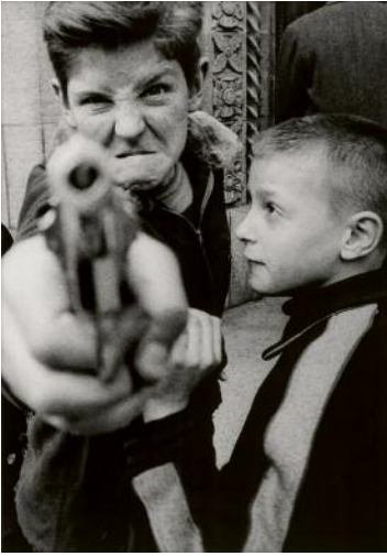
7_Gun 1, New York, 1955