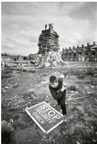
09_BELFAST, NORTHERN IRELAND, 1989. Locals make final preparations for the Eleventh night bonfire, which burns to usher in the Twelfth of July, the most important event of the year for Ulster Protestants