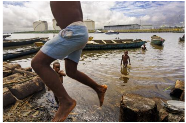
02_BONNY ISLAND, NIGER DELTA, 2004. Children play in the polluted waters of Bonny island in the Niger Delta where the Nigerian Liquefied Natural Gas plant is located.