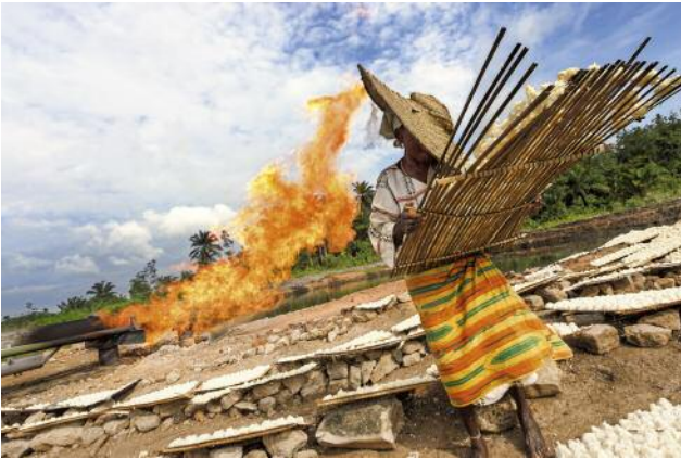
07_AFIESERE, NIGERIA, 2004. Local Urohobo people bake tapioca cakes, known as krokpo-garri, in the heat of a gas flare.