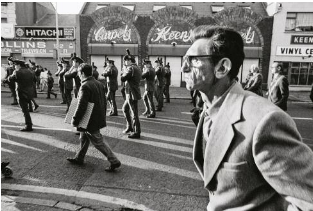
05_BELFAST, NORTHERN IRELAND, 1989. A Loyalist parade marches through the Protestant heartland of East Belfast.