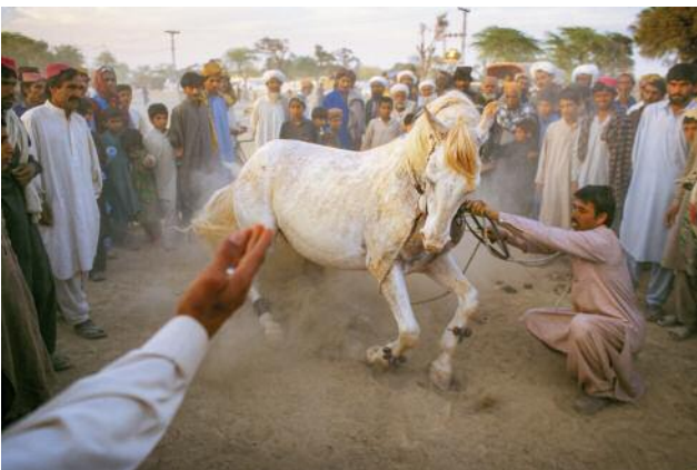
11_BALOCHISTAN, PAKISTAN, 1998. A horse dance is performed at the Sibi Mela Camel Festival.