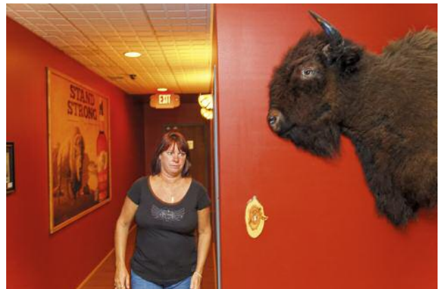
06_SPRINGFIELD, MISSOURI, USA, 2014. Patrons enjoy themselves at the Buffalo Tap Bar.