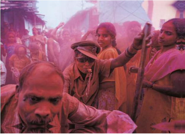
01_VADHAV, INDIA, 2007. Villagers celebrate the Ganapati Festival to honor the Lord Ganesh