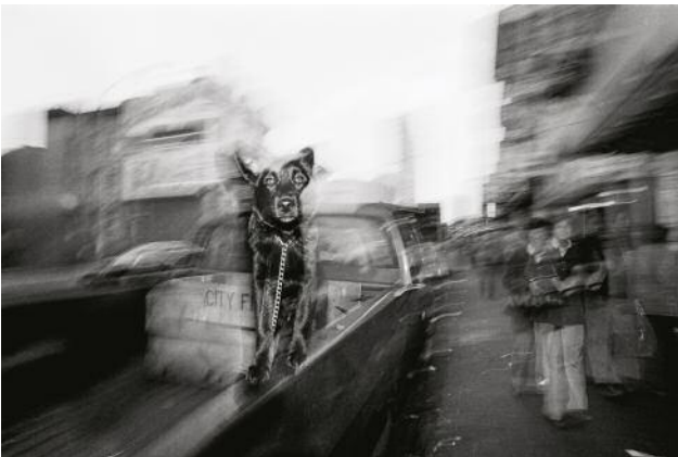
03_SAN FRANCISCO, CALIFORNIA, USA, 1981. A dog rides in the back of a pickup truck through the streets of the Mission District at dusk.