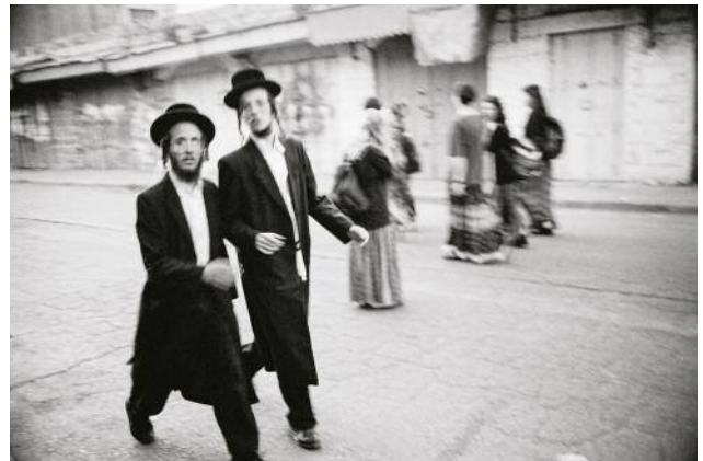
04_HEBRON, ISRAEL, 1995. Visiting Hasidic Jews stroll freely through the Jewish section of Hebron, the contested land in Israel's West Bank