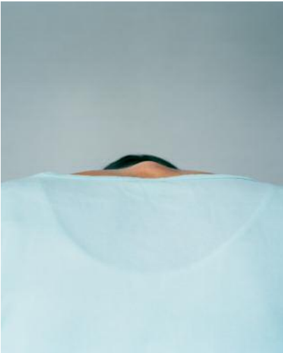
1_ © Erik Östenson