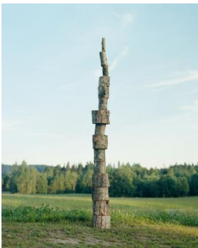
5 © Erik Östenson