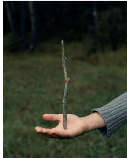
2_BU © Erik Östenson