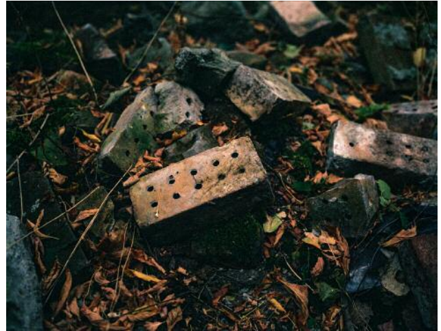
08 © Ethna O'Regan