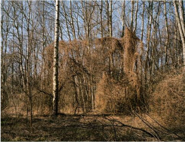
07 © Ethna O'Regan