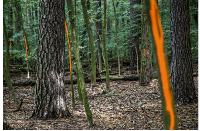
02 © Ethna O'Regan