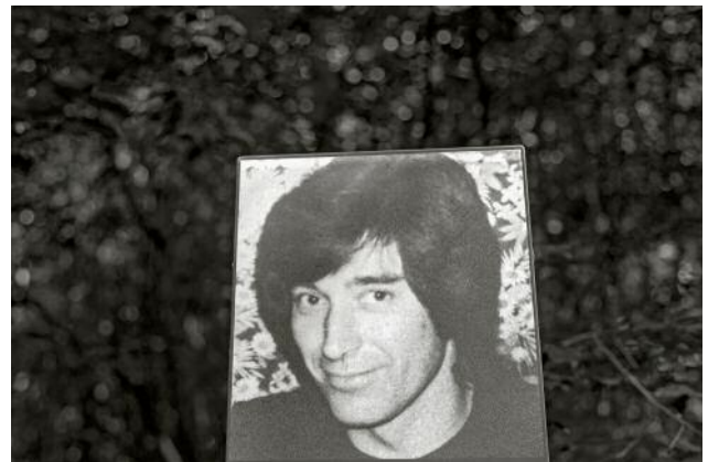
12 Rainer Liebeke © Ethna O'Regan