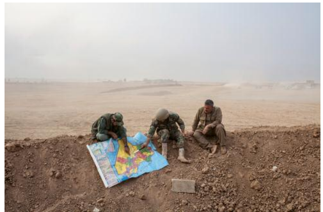
4_ Three peshmergas look at a map after a day of fighting.