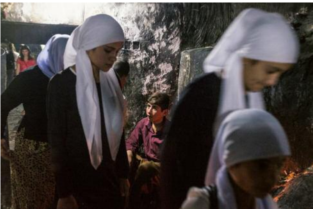
11_A group of young worshippers walk between rooms inside Lalish temple; in the background, a boy guards one of the shrines. The religion celebrates the sun and light as manifestations of God, and many Yazidi rituals involve fire.