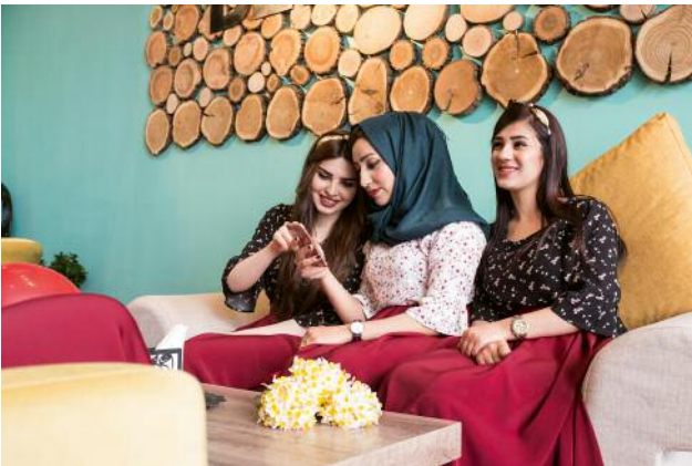
9_Three young women enjoy themselves at a book café open by a female entrepreneur in Erbil's new compound Dream City.