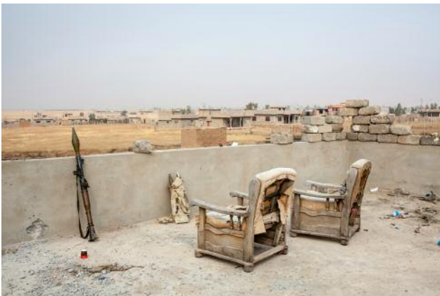
3_ A peshmerga rooftop observation post.