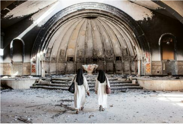
7_Two sisters of the Dominican Order of Saint Catherine walk inside the Church of Saint Banham and Saint Sarah in Qaraqosh. The church had been devastated during ISIS occupation.