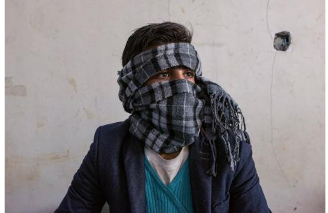
2_ Unaccompanied boy poses for a portrait in the shelter run by the Italian NGO Terre des Hommes in the Debaga camp.