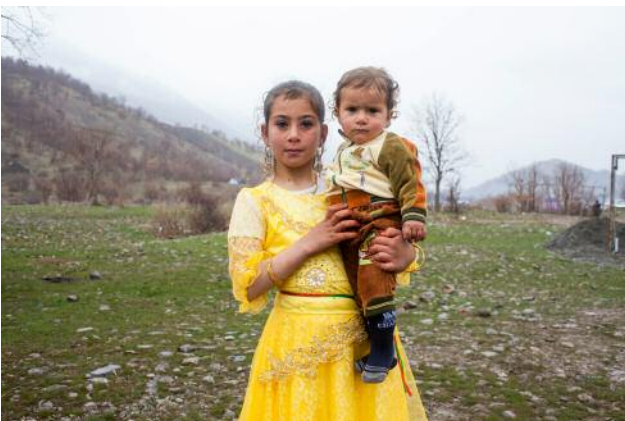
5_ A girl wearing a traditional Kurdish dress holds her brother and poses for a portrait during the Newroz celebration.