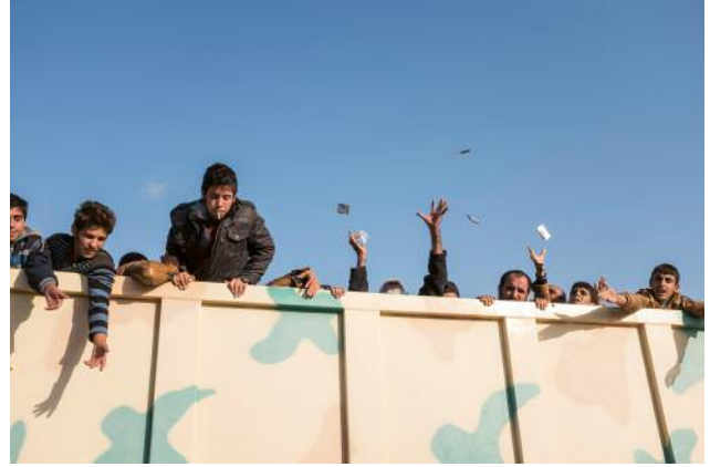
8_Men loaded in the back of a truck try to catch packs of cigarettes thrown at them by peshmergas. Smoking was forbidden under ISIS and punishable by imprisonment.