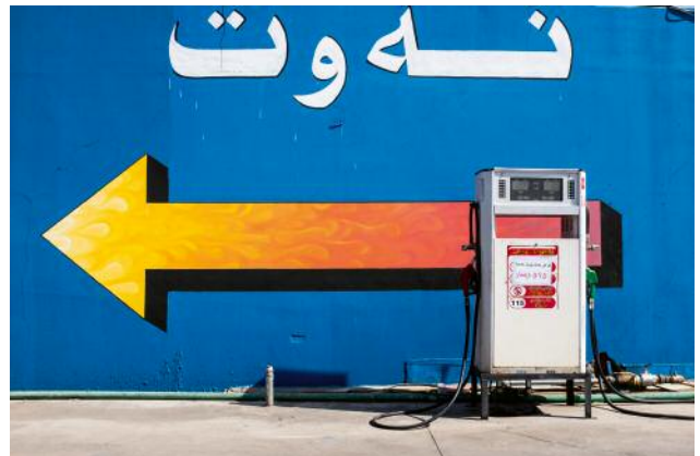
12_Detail of a petrol station near Sulaymaniyah.