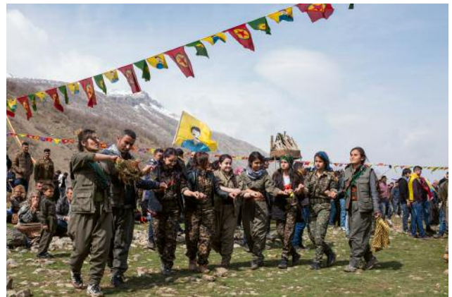
6_ A group of female guerrillas dance in Qandil during Newroz (Persian New Year).