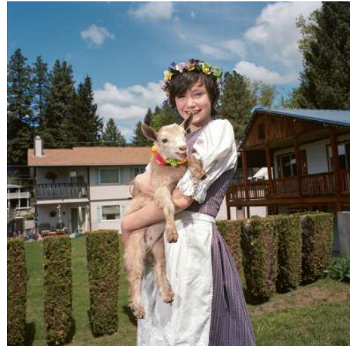
2 Maifest, Leavenworth, Washington