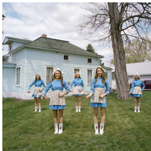
6 Tulip Festival, Orange City, Iowa, USA