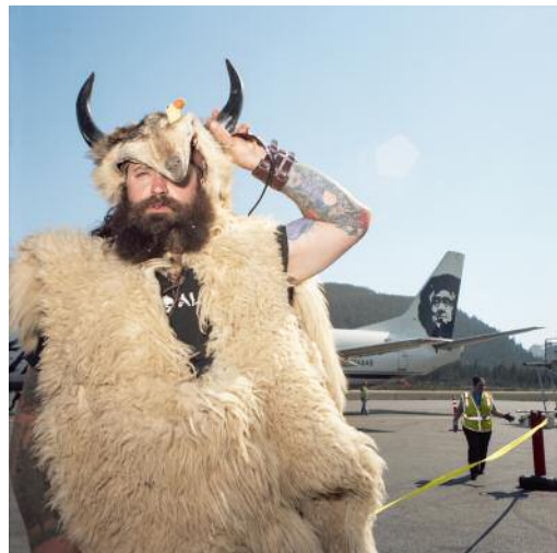
4 Little Norway Festival, Petersburg, Alaska, USA