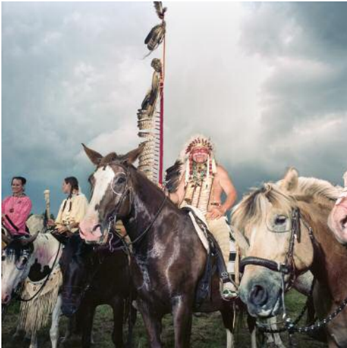
1 The Last Indian Wars, Brezno, Czech Republic