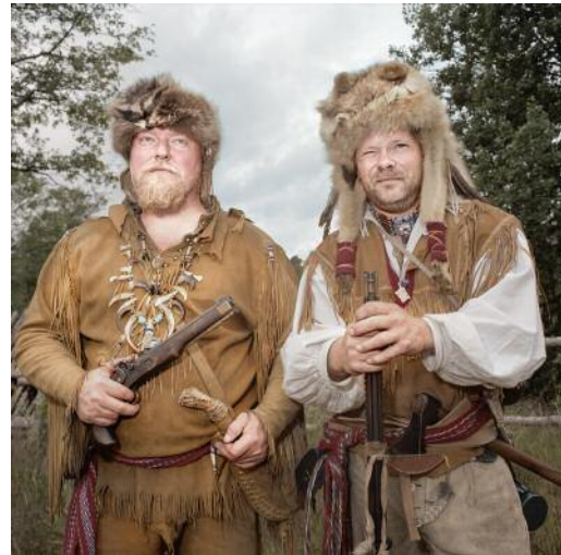
12 High Chaparral, Hillerstorp, Sweden