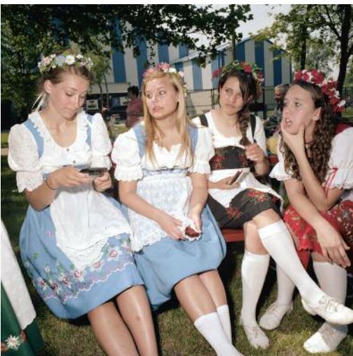
11 Bavarian Festival, Frankenmuth, Michigan, USA