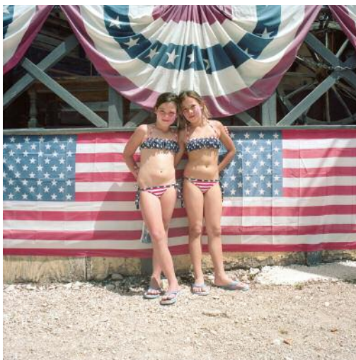
5 OK Corral, Cuges-les-Pins, France © Naomi Harris