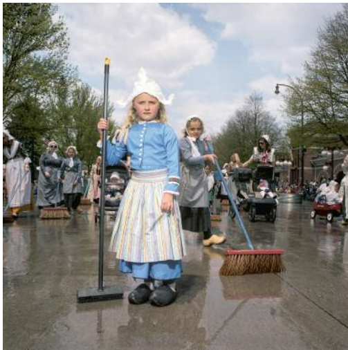
3 Tulip Festival, Orange City, Iowa