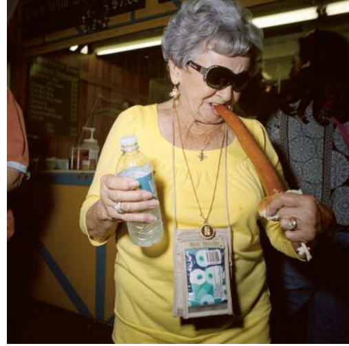
8 Wurst Fest, New Braunfels, Texas, USA