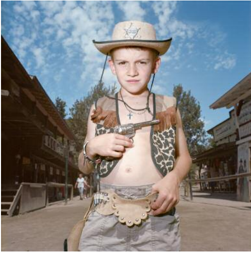
7 Westernstadt Pullman City, Eging am See, Germany