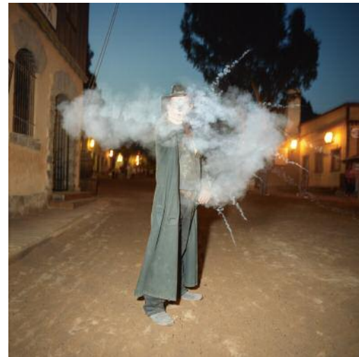
10 Sioux City, San Agustín, Las Palmas, Spain