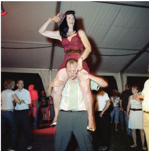
9 Rock & Roll and US Car Weekend, Agárd, Hungary