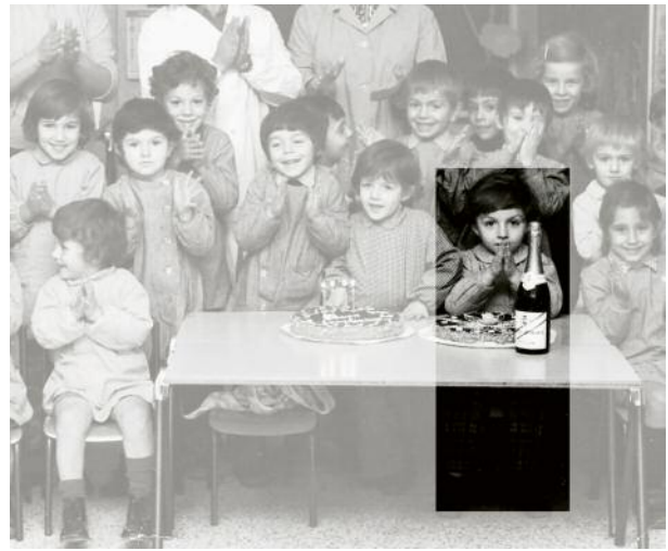
4 © Francesca Catastini