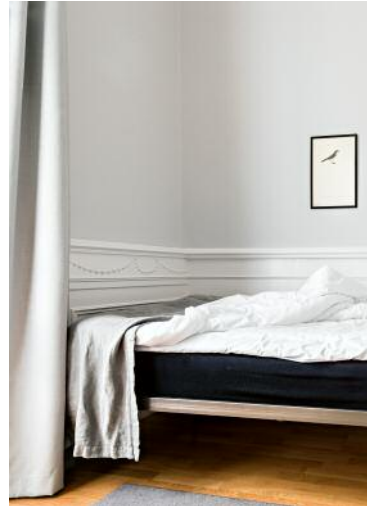
10 © Francesca Catastini