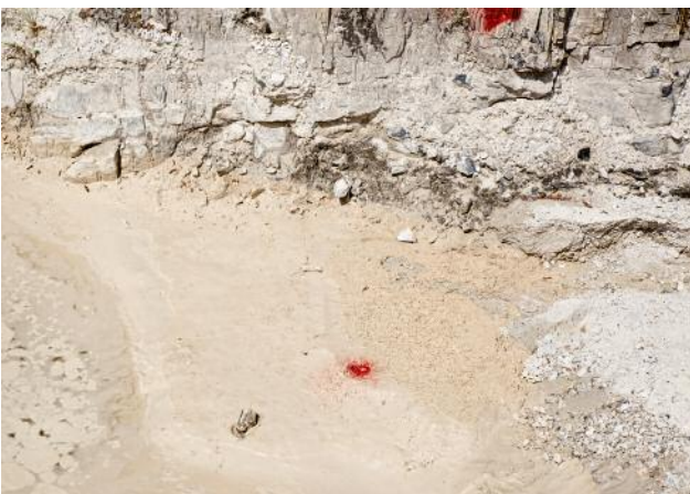
5 © Francesca Catastini