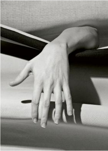
9 © Francesca Catastini