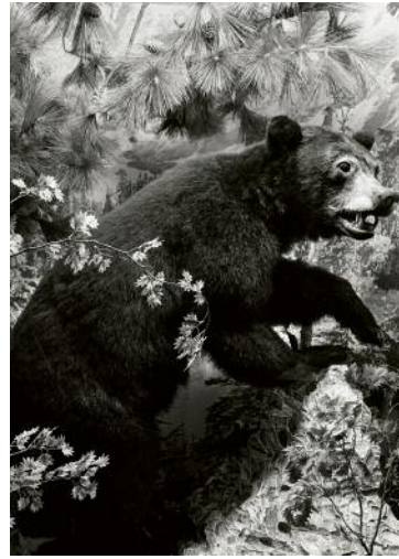
2_ © Francesca Catastini