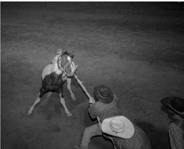
11 © Francesco Anselmi