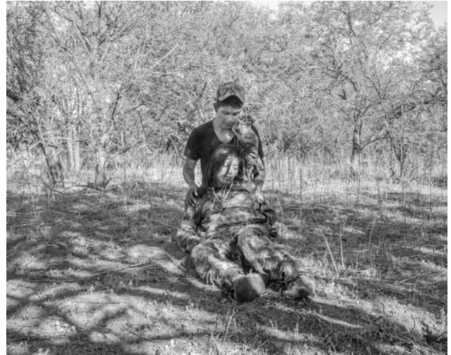
02 © Francesco Anselmi