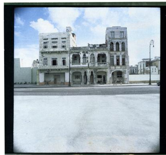
12 Uferpromenade Malecón