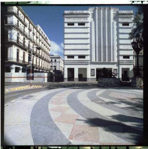
11 Paseo del Prado © Ewa Maria Wolańska