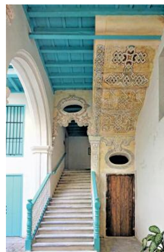
06 Vivienda Amargura, Treppenaufgang