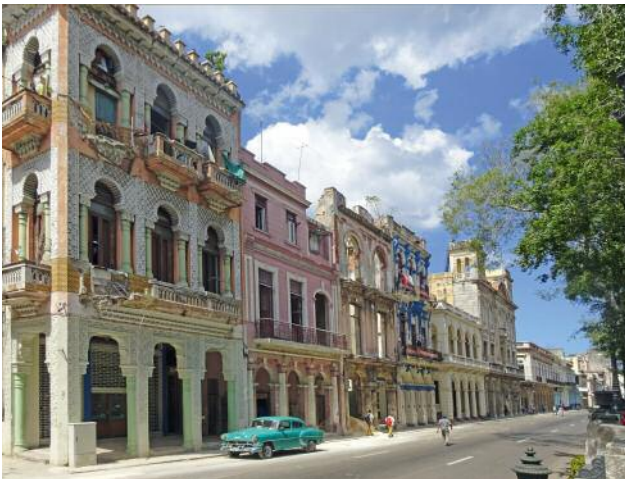
03 Paseo del Prado