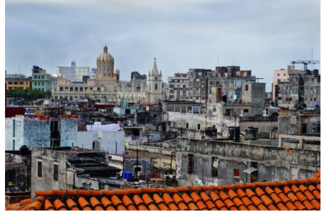
08 Blick über die Altstadt