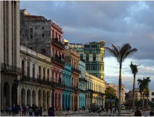
01 Paseo del Prado gegenüber Capitolio