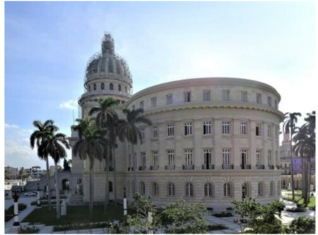
02 Capitolio Nacional