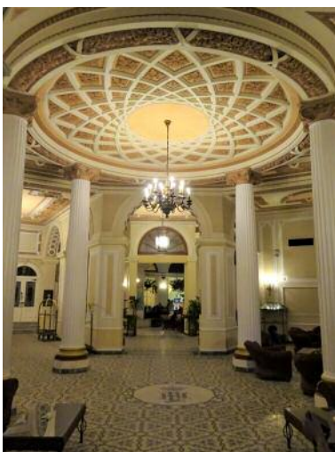
05 Hotel Plaza, Foyer