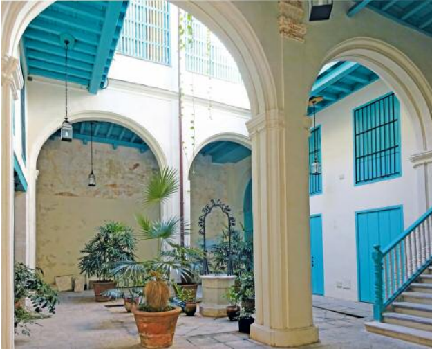
07 Vivienda Amargura, Innenhof