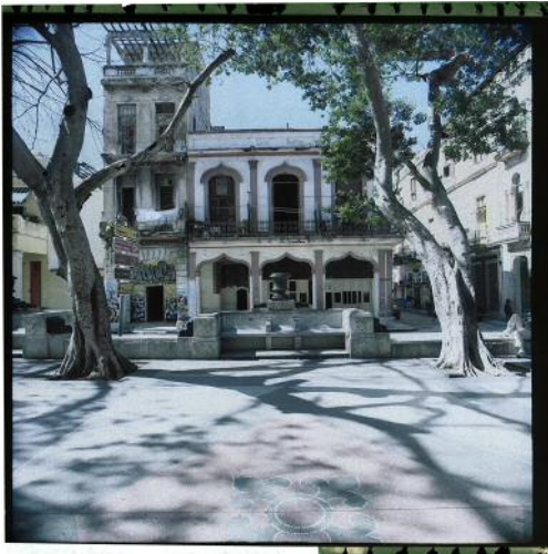
09 Paseo del Prado