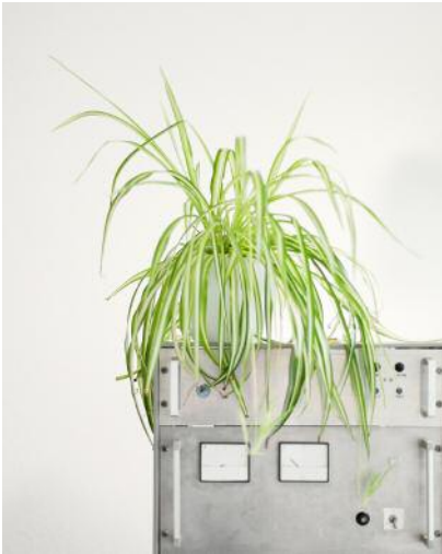
1 Sabine geht unheimlich gerne Tanzen.