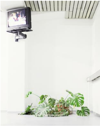
7 Dagmar mag kein Fernsehen.