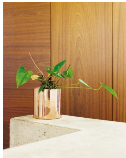
4 Sören will mehr als nur einen Job.