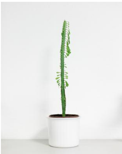
3 René hat ein Geheimnis. © Frederik Busch