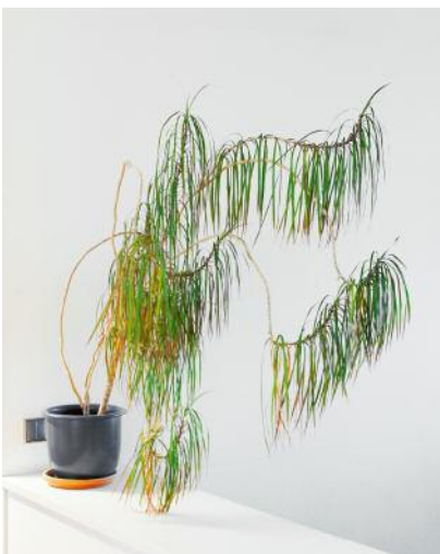
5 Solveigh mag fremde Kulturen.