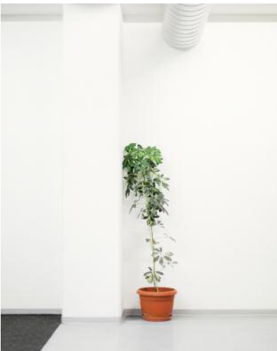
9 Siegfried schämt sich.