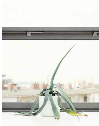
10 Ingrid gibt nicht auf.