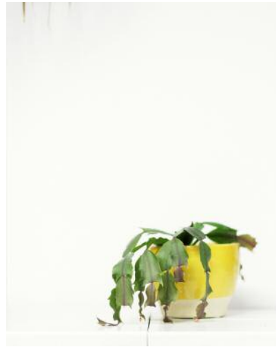
8 Paul ist traurig. © Frederik Busch