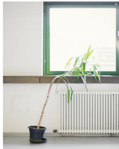
6 Ute leidet unter Tagträumen.