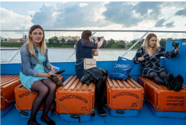
09_ © Gouzelle Ishmatova