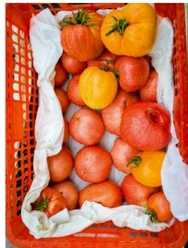
10_ © Gouzelle Ishmatova