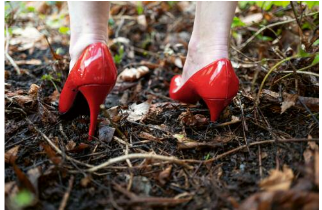
08_ © Gouzelle Ishmatova