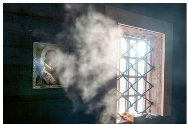
12_ © Gouzelle Ishmatova