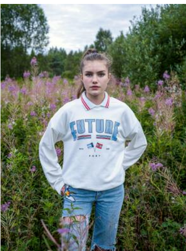
05_ © Gouzelle Ishmatova