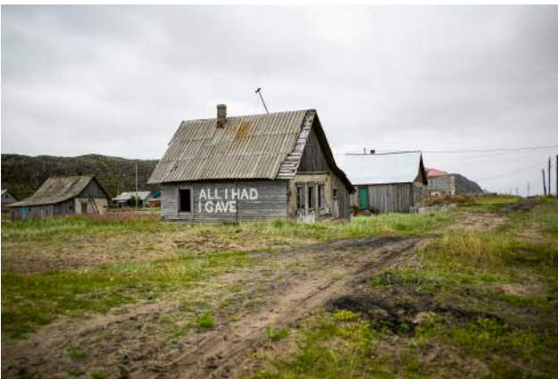
03_ © Gouzelle Ishmatova