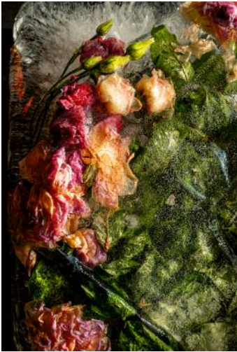
01_ © Gouzelle Ishmatova