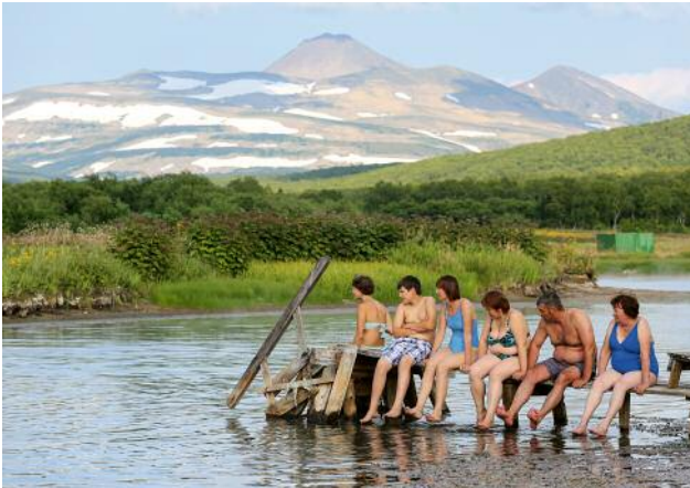
07_ © Gouzelle Ishmatova