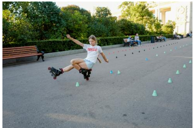
04_ © Gouzelle Ishmatova