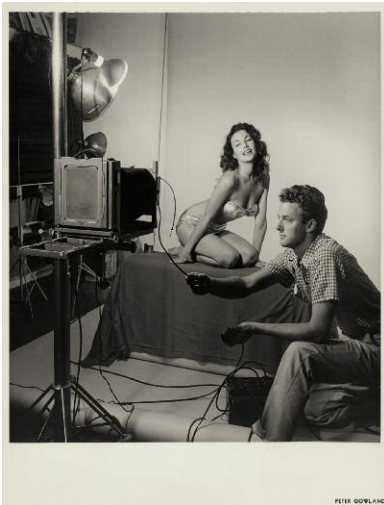
3 © Peter Gowland