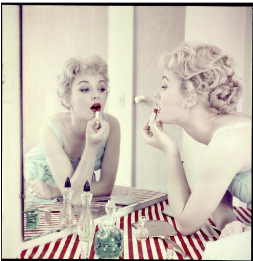
11 © Peter Gowland