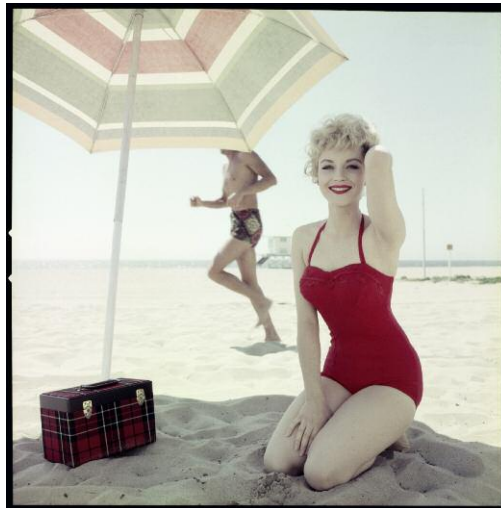
2 © Peter Gowland