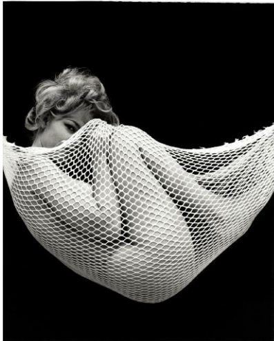
1 © Peter Gowland