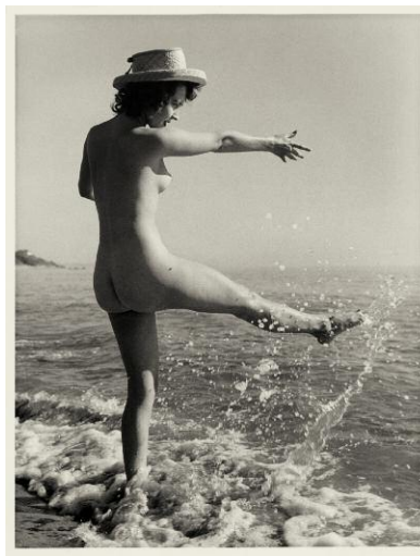
12 © Peter Gowland