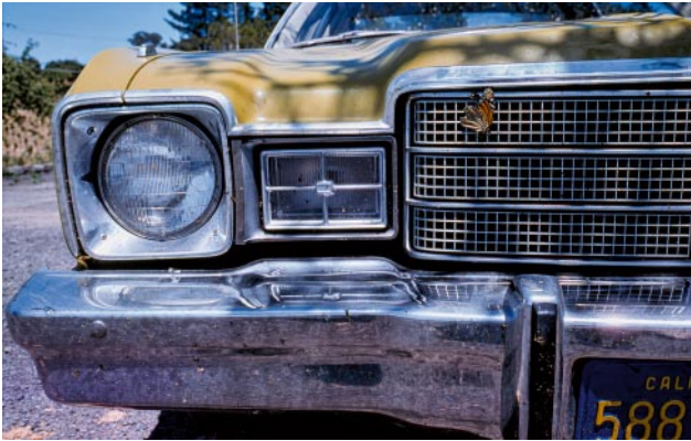
01_Vereinigte Staaten, 1970er Jahre