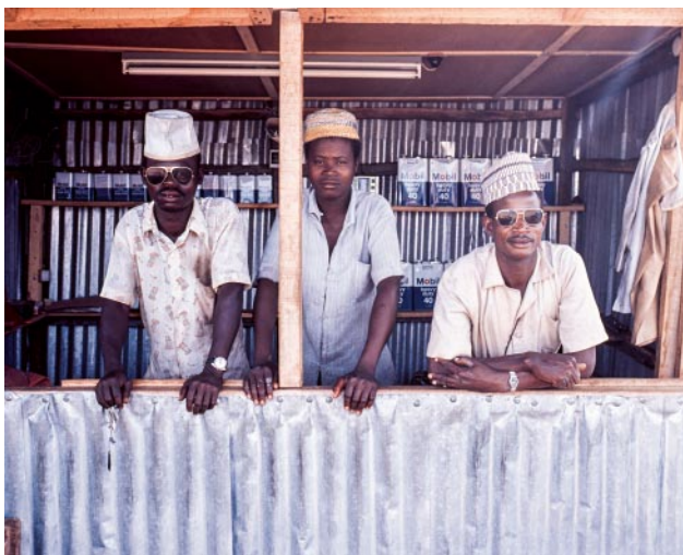
11_Nigeria, 1970er Jahre