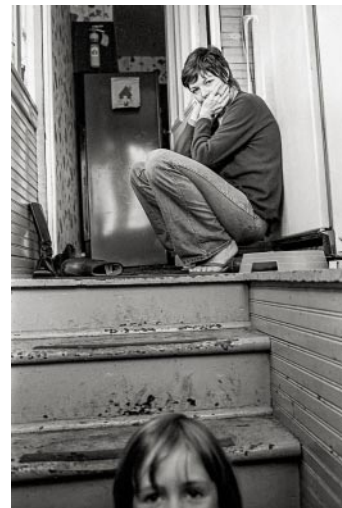
04_Vereinigte Staaten, 1970er Jahre