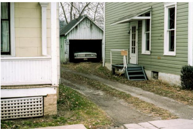
05_Vereinigte Staaten, 1970er Jahre