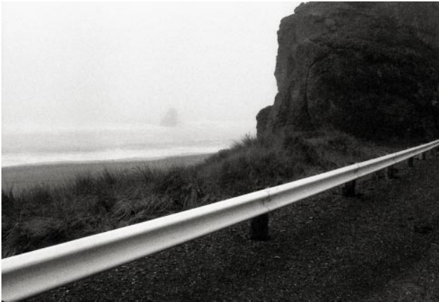
07_Vereinigte Staaten, 1970er Jahre