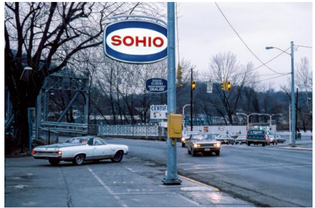
08_Vereinigte Staaten, 1970er Jahre