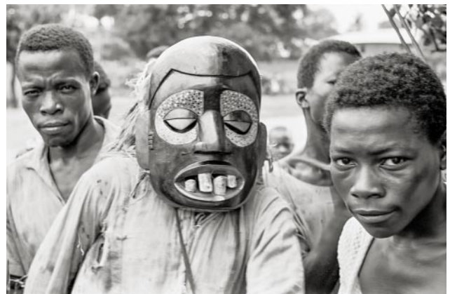
12_Nigeria, 1970er Jahre