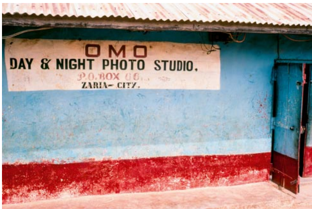
03_Nigeria, 1970er Jahre