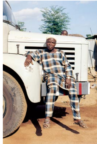
02_Nigeria, 1970er Jahre