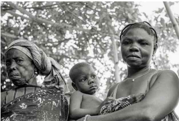
09_Nigeria, 1970er Jahre