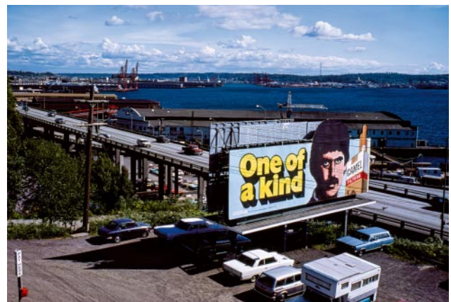
06_Vereinigte Staaten, 1970er Jahre