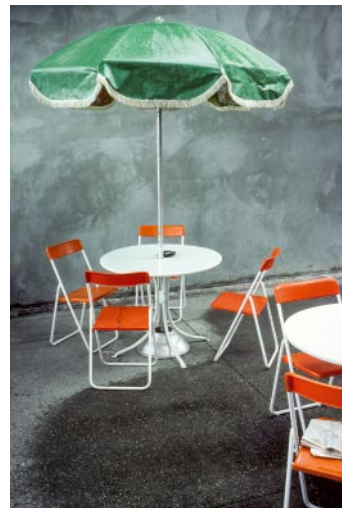
10_Vereinigte Staaten, 1970er Jahre