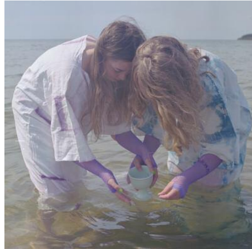
02_ © Hertta Kiiski und VG Bild-Kunst, Bonn