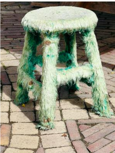
09_ © Hertta Kiiski und VG Bild-Kunst, Bonn