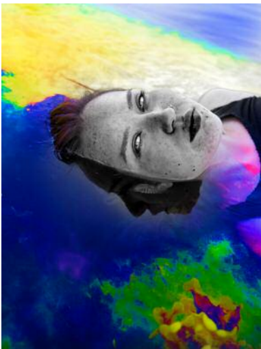
05_ © Hertta Kiiski und VG Bild-Kunst, Bonn