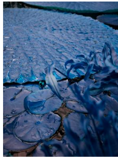
10_ © Hertta Kiiski und VG Bild-Kunst, Bonn