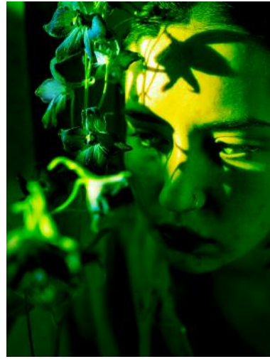
08_ © Hertta Kiiski und VG Bild-Kunst, Bonn