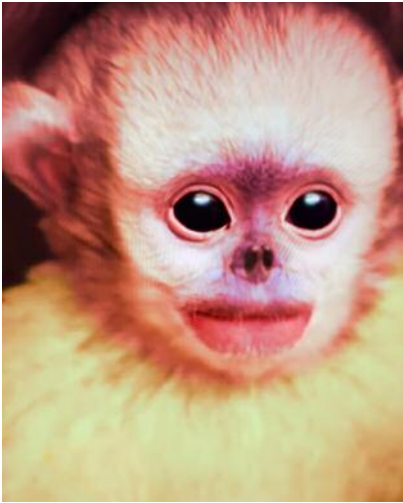
01_ © Hertta Kiiski und VG Bild-Kunst, Bonn