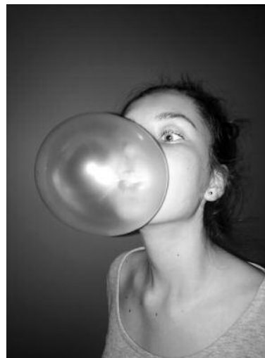
06_ © Hertta Kiiski und VG Bild-Kunst, Bonn