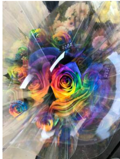
04_ © Hertta Kiiski und VG Bild-Kunst, Bonn