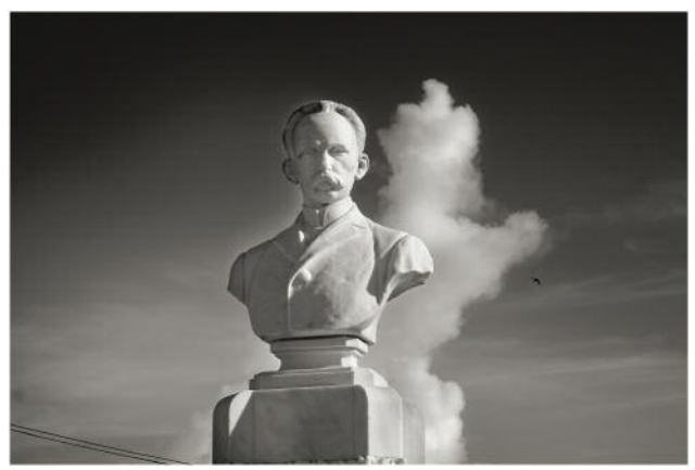
6 from the series José Martí , Cuba, 2009