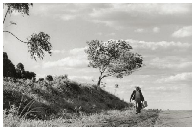
12_ Caminante Mismes , Argentina, 1980