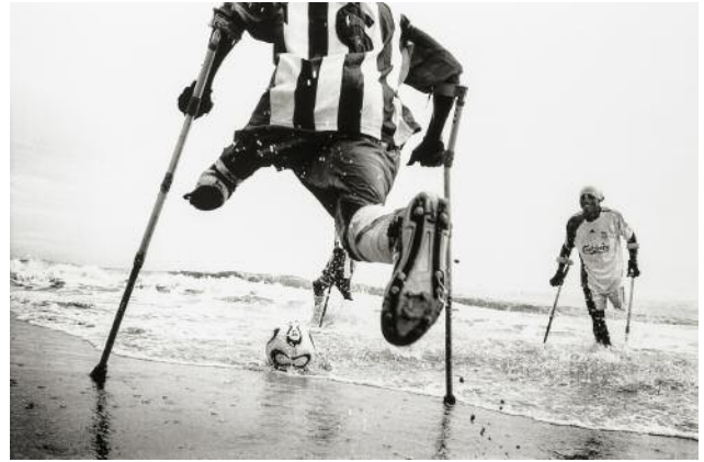
8_ from the series One Goal , Sierra Leone, 2007