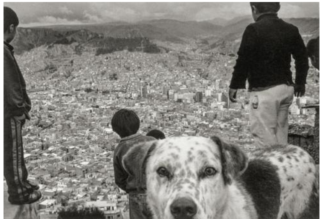
4 La Paz , Bolivia, 2006