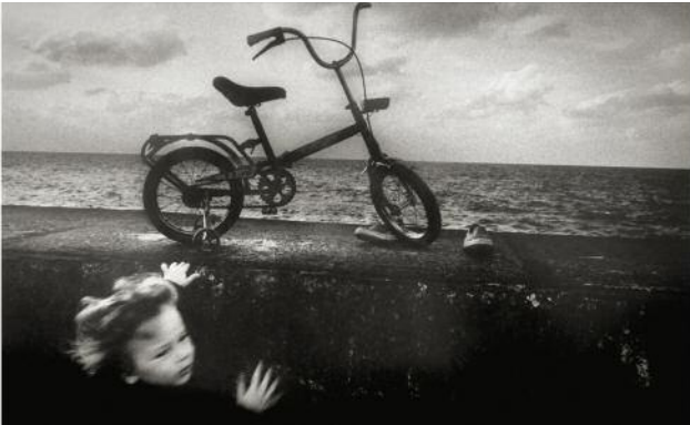
7_untitled, Cuba, 1989