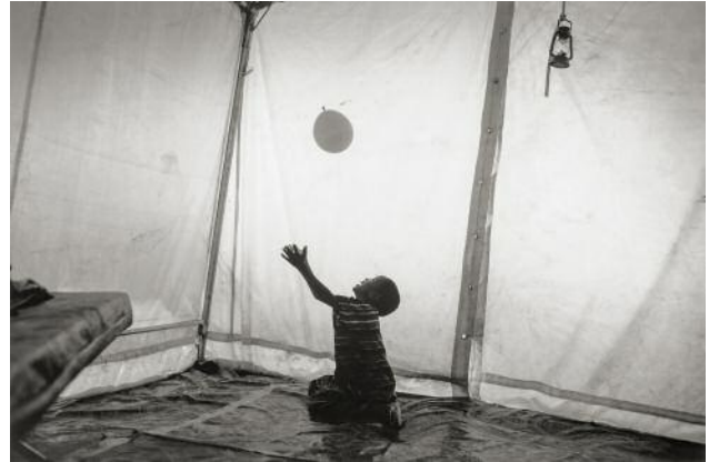
14_ from the series Somalia , Dollo Ado, Ethiopia, 2011