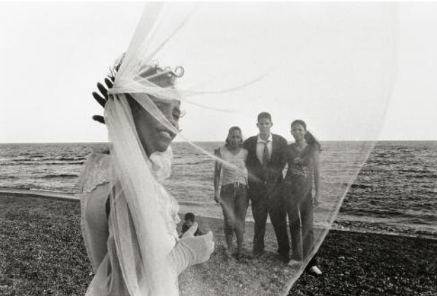
9_untitled, from the series Malecón , Cuba, 2006