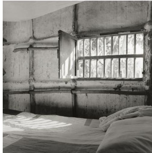
2 Cama y ventana , Tolu, Columbia, 1992