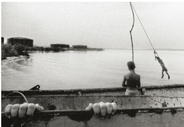
5 Bahía de Cienfuegos , 2003