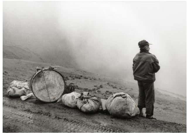
10_ Músico en la nada , Escoma, Bolivia, 1990