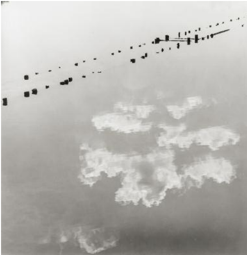
1 Ses Salines , Ibiza, Spain, 2004