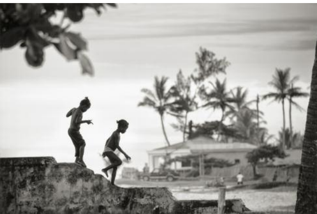
11_untitled, Madagascar, 2013