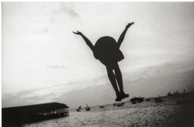
3 The Jump , Indian Ocean, Zanzibar, 2009