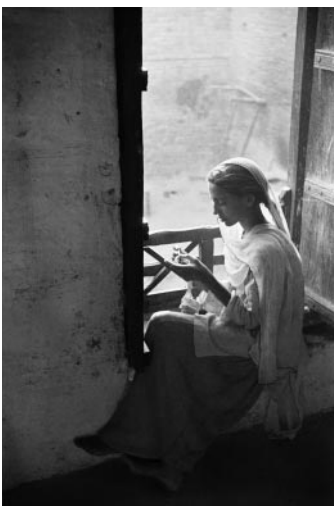
05_ Frank Horvat, Karachi, Pakistan, 1952