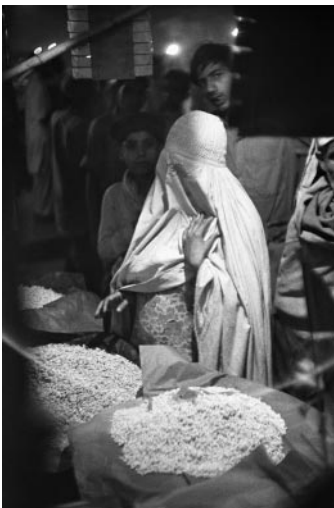
03_ Frank Horvat, Night market, Lahore, Pakistan, 1952