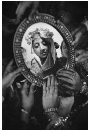
02_ Frank Horvat, Husband discovering the face of his wife in a mirror, Lahore, Pakistan, 1952 © Frank Horvat Studio