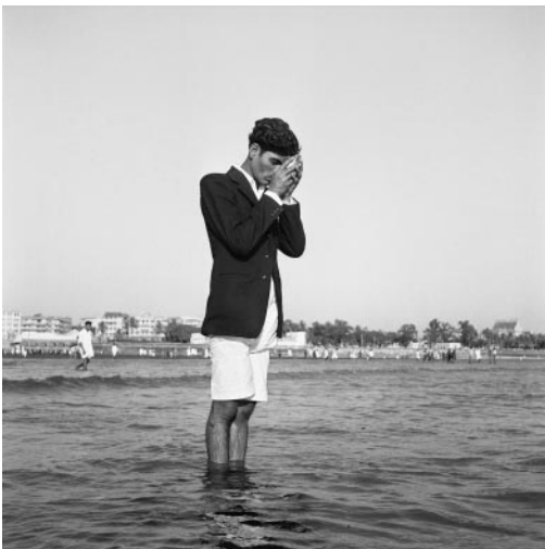
09_ Frank Horvat, Man praying, Bombay, India, 1953