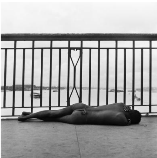
11_ Frank Horvat, Howra Bridge, Calcutta, India, 1953 © Frank Horvat Studio