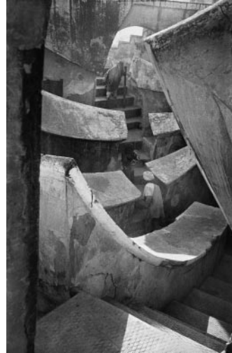
08_ Frank Horvat, Jantar Mantar, New Delhi, India, 1952