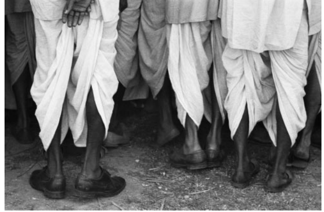
14_Frank Horvat, Calcutta, India, 1962