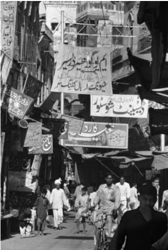
01_ Frank Horvat, Bazaar, Lahore, Pakistan, 1952 © Frank Horvat Studio