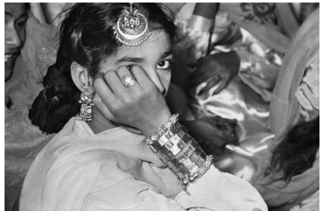
04_ Frank Horvat, Red-light district of Hira Mandi, Lahore, Pakistan, 1952 © Frank Horvat Studio