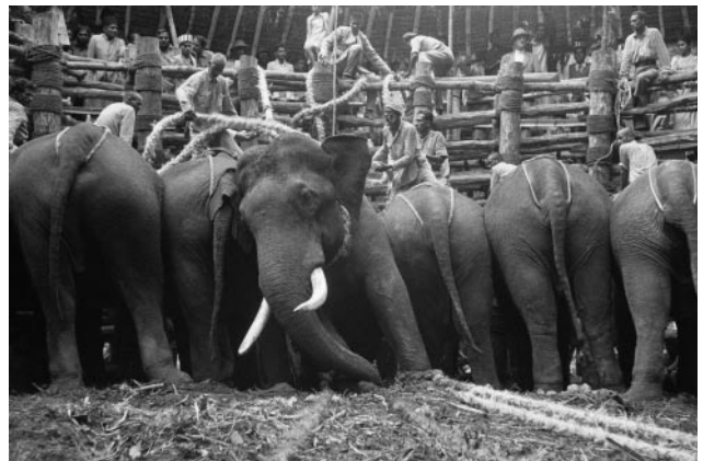
10_ Frank Horvat, Khedda, near Mysore, India, 1953