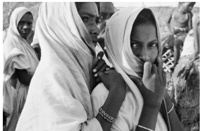
06_ Frank Horvat, Women listening to Vinoba Bhawe speech, Bihar, India, 1953 © Frank Horvat Studio