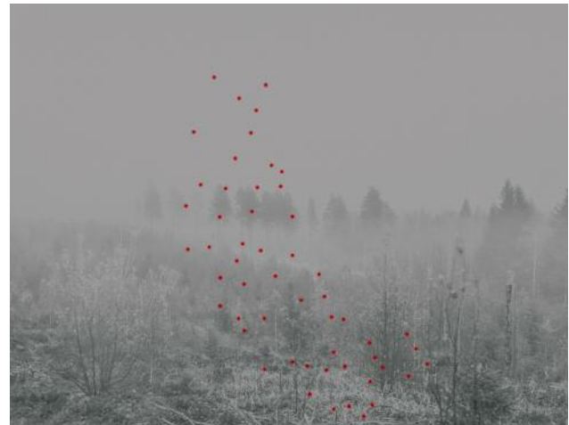
04 54 Different Solutions , 2017 © Jaakko Kahilaniemi