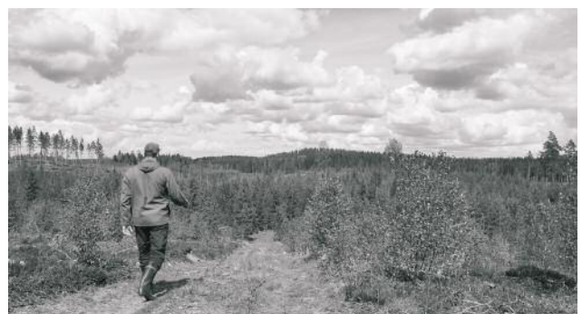
12 Making of Colliding Generations , 2017 © Jaakko Kahilaniemi