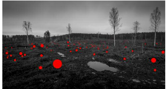
02 100 Mistakes Made by Previous Generations , 2017