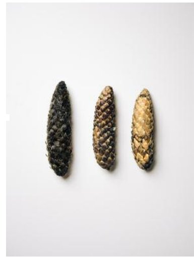
10 Picked Fragments , 2016