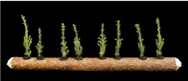
03 Colliding Generations , 2017 © Jaakko Kahilaniemi