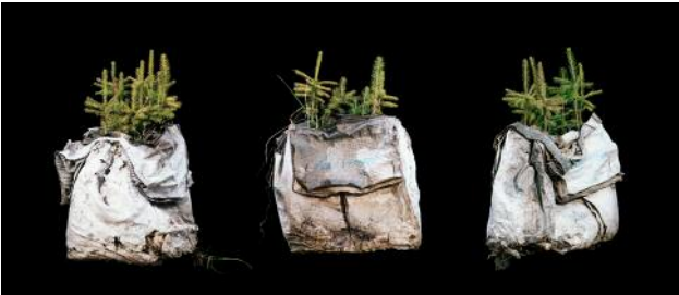
07 Package of Power , 2020 © Jaakko Kahilaniemi