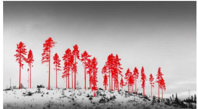
08 Next Possible Victims , 2018 © Jaakko Kahilaniemi