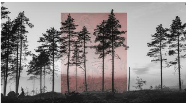
11 Patriotism and Romanticism Studies (Gallen Kallela 1896) , 2017 © Jaakko Kahilaniemi