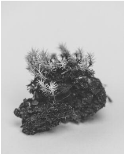
01 54 Grams of Soil from 54 Different Solutions , 2017 © Jaakko Kahilaniemi