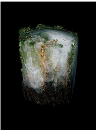
09 Preserving Nature , 2018