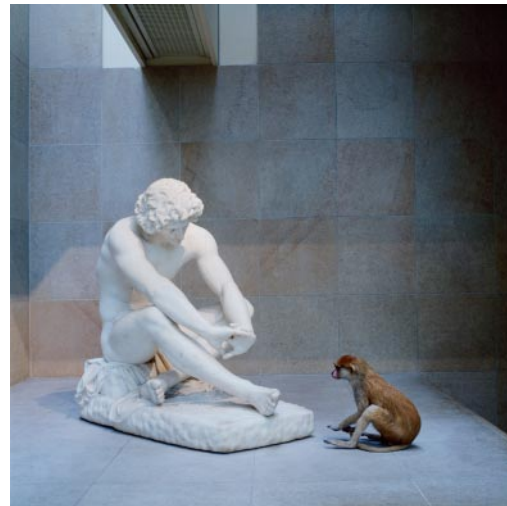
04_ Despair Musée d'Orsay, Paris, France, 1998 © Karen Knorr