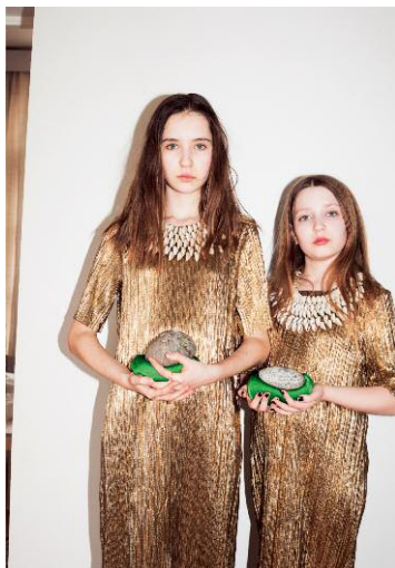
9 © Hertta Kiiski