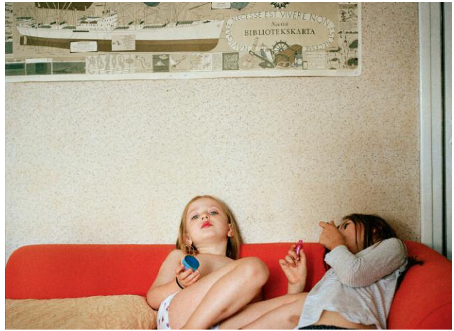
2 © Hertta Kiiski