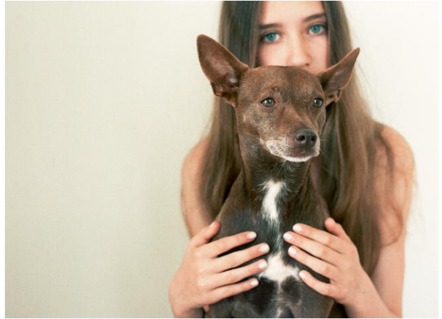
8 © Hertta Kiiski