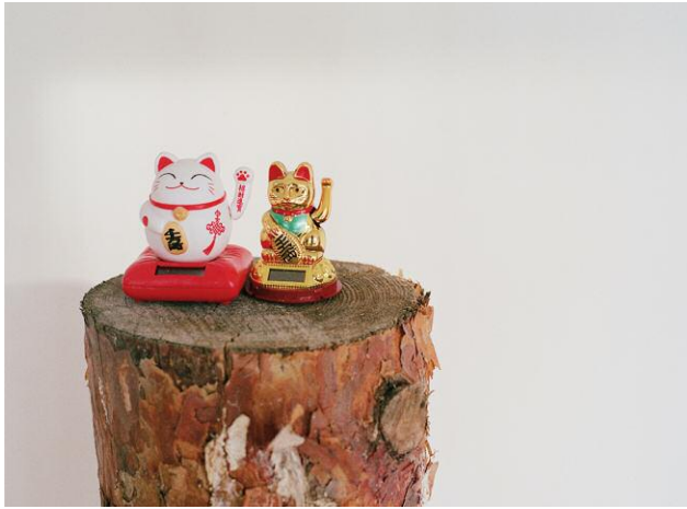
1 © Hertta Kiiski