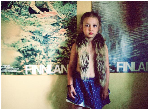
3 © Hertta Kiiski