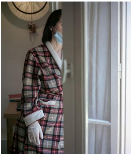
11_ © Demetris Koilalous