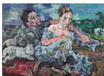
Oskar Kokoschka, Liebespaar mit Katze, 1917 Öl auf Leinwand, 93,5 x 130,5 cm Kunsthaus Zürich, 1933 © Fondation Oskar Kokoschka / 2018 ProLitteris, Zürich