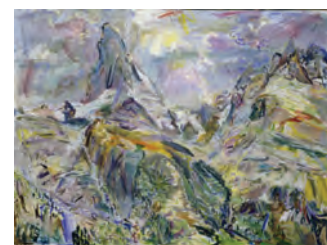
Oskar Kokoschka, Matterhorn II, 1947 Öl auf Leinwand, 90 x 120 cm Privatbesitz Schweiz