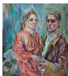
Oskar Kokoschka, Doppelbildnis Oskar Kokoschka und Alma Mahler, 1912/1913 Öl auf Leinwand, 100 x 90 cm Museum Folkwang, Essen Foto: Museum Folkwang Essen/Artothek © Fondation Oskar Kokoschka / 2018 ProLitteris, Zürich