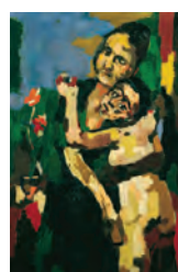
Oskar Kokoschka, Mutter und Kind einander umarmend, 1921/1922 Öl auf Leinwand, 121 x 81 cm Belvedere, Wien © Fondation Oskar Kokoschka / 2018 ProLitteris, Zürich