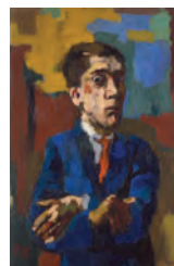
Oskar Kokoschka, Selbstbildnis mit gekreuzten Armen, 1923 Öl auf Leinwand, 110 x 70 cm Kunstsammlungen Chemnitz, Leihgabe © Fondation Oskar Kokoschka / 2018 ProLitteris, Zürich