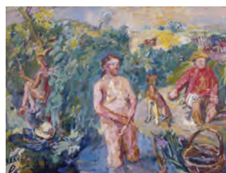
Oskar Kokoschka, Sommer II (Zráni), 1938-1940 Öl auf Leinwand, 68,3 x 89,2 cm National Galleries of Scotland, Edinburgh. Presented by the Czechoslovak Government in Exile 1942