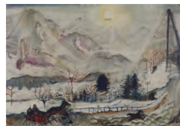
Oskar Kokoschka, Dent(s) du Midi, 1910 Öl auf Leinwand, 79,5 x 115,5 cm Privatbesitz © Fondation Oskar Kokoschka / 2018 ProLitteris, Zürich