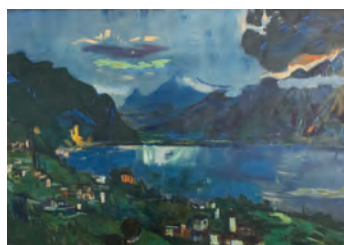
Oskar Kokoschka, Genfer See II, 1923 Öl auf Leinwand, 64 x 95 cm Museum Ulm - 1937 vom Reichsministerium beschlagnahmt, 2014 Schenkung in Erinnerung an Paul E. und Gabriele B. Geier © Fondation Oskar Kokoschka / 2018 ProLitteris, Zürich