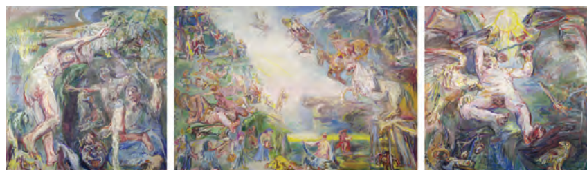
Oskar Kokoschka, Die Prometheus Saga (Hades und Persephone, Apokalypse, Prometheus), 1950 Öl und Mischtechnik auf Leinwand, Hades und Persephone: 239 x 234 cm / Apokalypse: 239 x 349 cm / Prometheus: 239 x 234 cm The Samuel Courtauld Trust, The Courtauld Gallery, London © Fondation Oskar Kokoschka / 2018 ProLitteris, Zürich