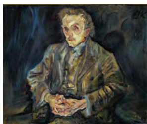
Oskar Kokoschka, Adolf Loos, 1909 Öl auf Leinwand, 74 x 91 cm Staatliche Museen zu Berlin, Nationalgalerie, Foto: Roman März © Fondation Oskar Kokoschka / 2018 ProLitteris, Zürich