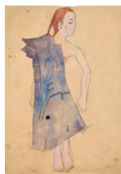
Oskar Kokoschka, Mädchenakt mit umgehängtem Mantel, 1907 Bleistift, Aquarell, auf Packpapier, 45,4 x 31,6 cm Wienerroither & Kohlbacher, Wien