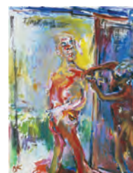
Oskar Kokoschka, Time, Gentlemen Please, 1971/1972 Öl auf Leinwand, 130 x 100 cm Tate: Purchased 1986 © Fondation Oskar Kokoschka / 2018 ProLitteris, Zürich