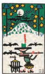
Oskar Kokoschka, Flötenspieler und Fledermäuse. Postkarte Nr. 73 der Wiener Werkstätte, 1907 Farblithografie, 14 x 9 cm Albertina, Wien © Fondation Oskar Kokoschka / 2018 ProLitteris, Zürich