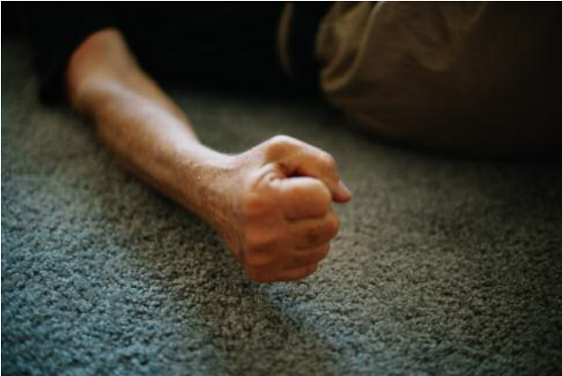
07 Will's fist on the floor of his apartment.