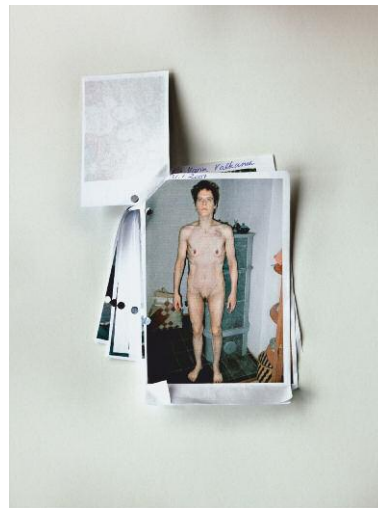
4_Visual Aid ©Karina-Sirkku Kurz