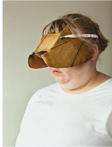
2_The Blinder I