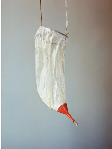
1_The Compensation Utensil