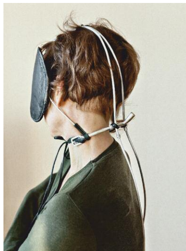
10_The Blinder II