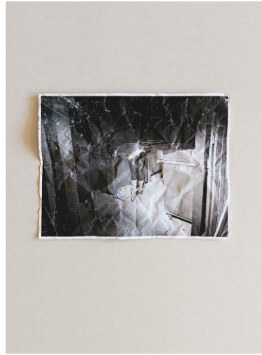
8_An Act of Compensation