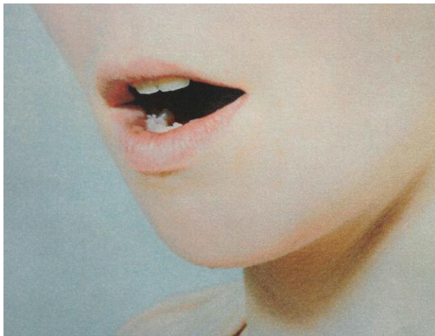
3_Access to the Soul