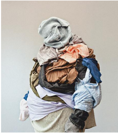
7_Wrapped in Memories I