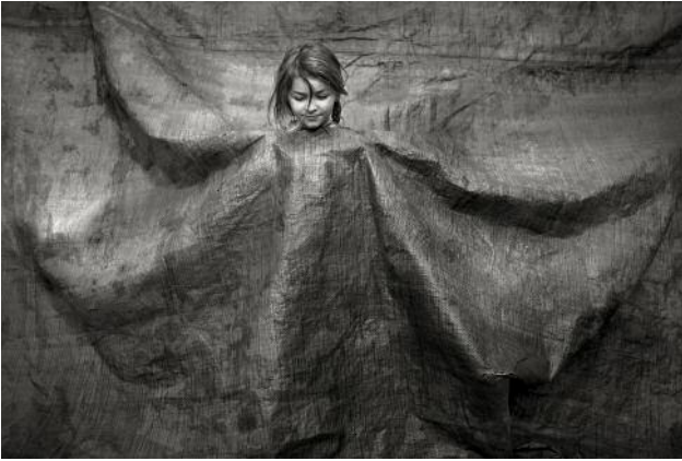
7 © Alain Laboile