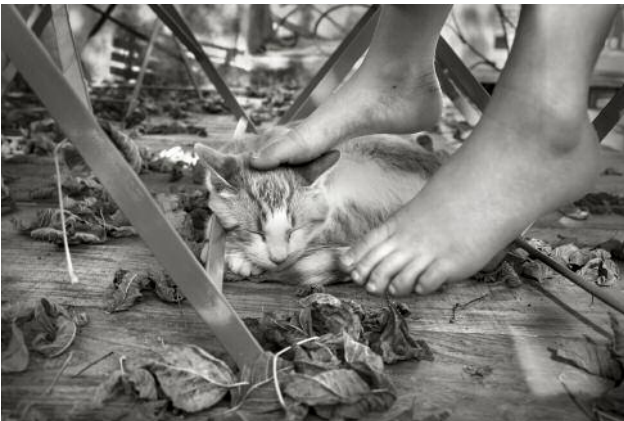
11 © Alain Laboile