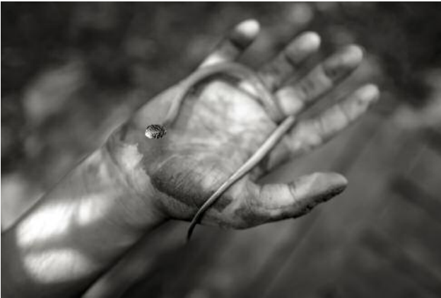
9 © Alain Laboile