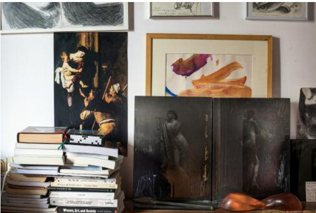
09_Suzanne © Sonia Lenzi