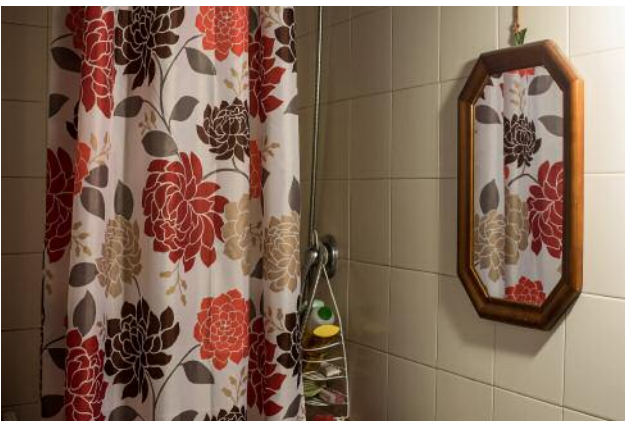
05_Suzanne © Sonia Lenzi