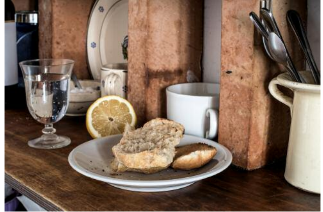
08_Suzanne © Sonia Lenzi