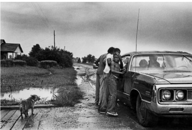
03_ Sunday School, 1980