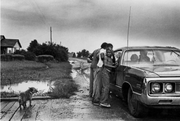
01_ A Humid Day, 1980 © Lisa McCord