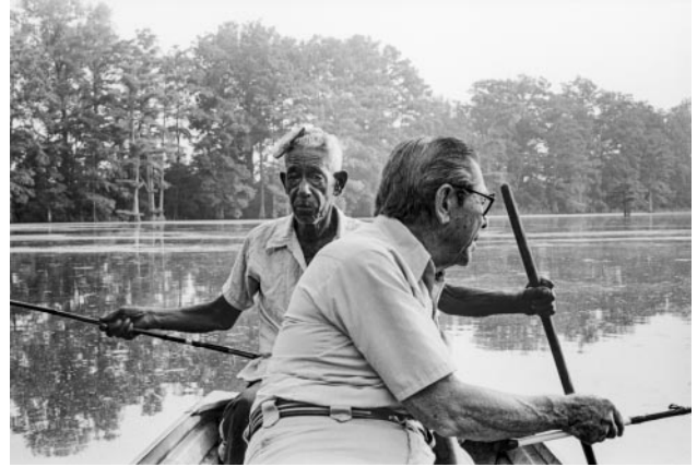
08_ Granddaddy and Sank Fishing, 1982