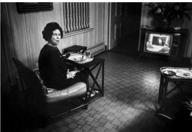
05_ Grandmother Watching TV, 1979