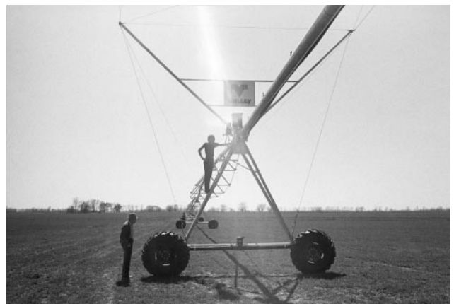
06_ Granddaddy and Lind, with Irrigation System, 1981