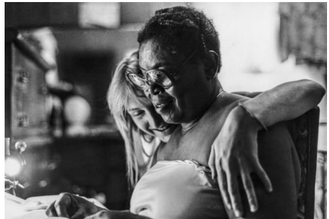
04_ Frances with Child, 1982 © Lisa McCord