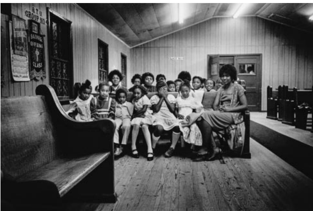
03_ Sunday School, 1980