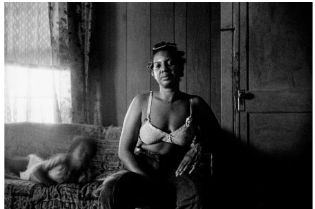
04_ Frances with Child, 1982 © Lisa McCord