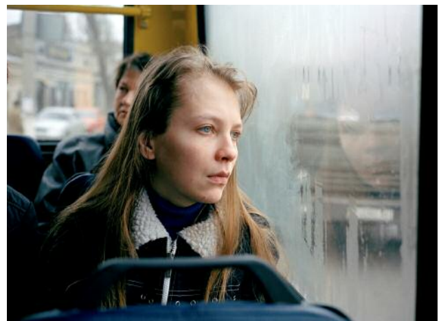
07/1 Aus der Ausstellung Fotografie & Wissenschaft Andrea Diefenbach, Natascha , 2006, aus der Serie AIDS in Odessa