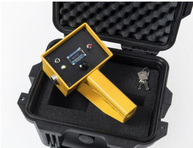
03/3 Aus der Ausstellung Reconsidering Icons . Dries Depoorter & Max Pinckers, Trophy Camera vo.9 , 2017