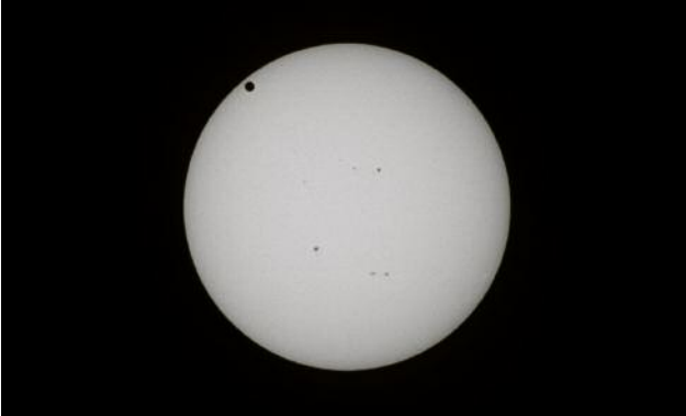
07/2 Aus der Ausstellung Fotografie & Wissenschaft Simon Starling, Black Drop , 2012, film still, 35 mm, in HD übertragener Schwarz-Weiß-Film mit Ton, 27' 42".