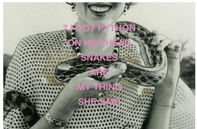
06/1 Aus der Ausstellung Yesterday's News Today Clare Strand, aus der Serie Snake , 2017