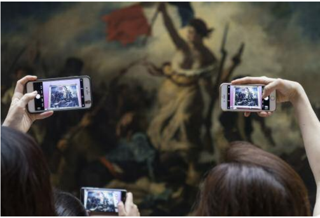
01/1 Aus der Ausstellung All Art is Photography Antonio Pérez Río, Liberty Leading the People , aus der Serie Masterpieces , 2017