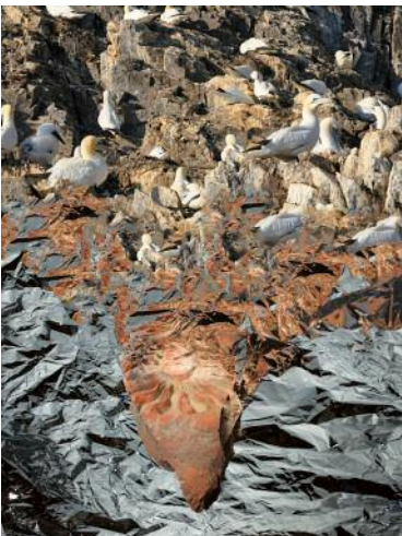
05/3 Aus der Ausstellung When Images Collides Aaron Hegert, Shallow Learning #34, aus der Serie Shallow Learning , 2018