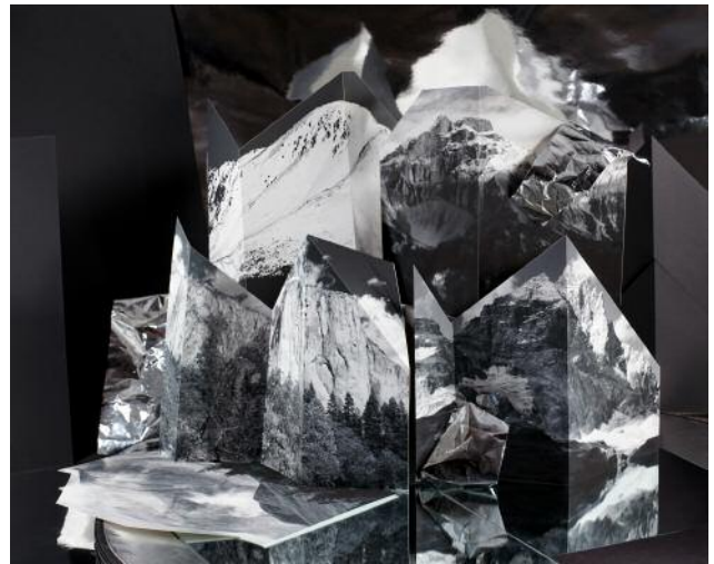
05/2 Aus der Ausstellung When Images Collide , Anastasia Samoylova, Black and White Mountains , aus der Serie Landscape Sublime , 2015