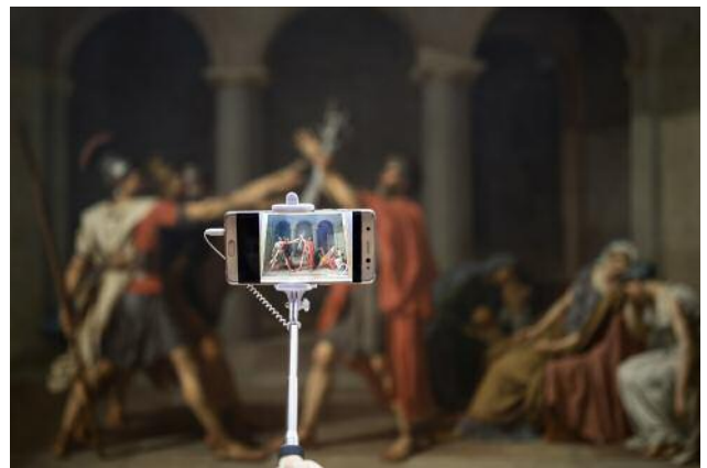
01/2 Aus der Ausstellung All Art is Photography Antonio Pérez Río, Oath of the Horatii , from the series Masterpieces , 2017