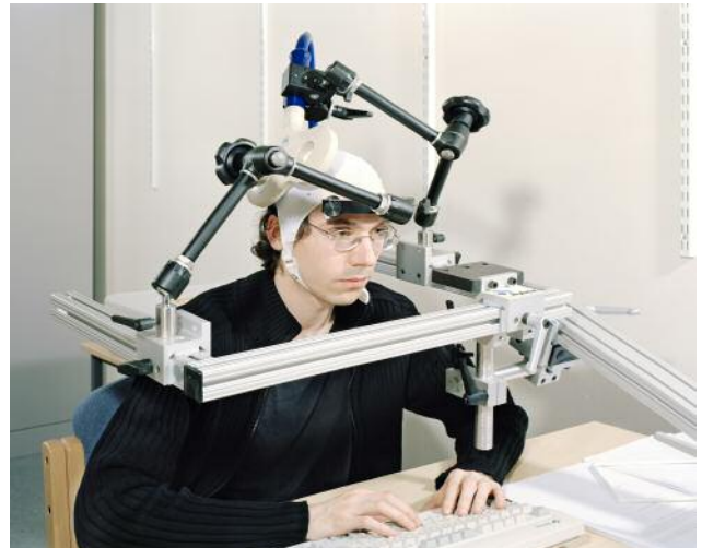
02/1 Aus der Ausstellung Between Art and Commerce Daniel Stier, ways of knowing , 2015