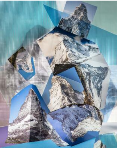
05/1 Aus der Ausstellung When Images Collide , Anastasia Samoylova, Six Real Matterhorns , aus der Serie Landscape Sublime , 2019 © Anastasia Samoylova, Courtesy: Galerie Caroline O'Brien Amsterdam