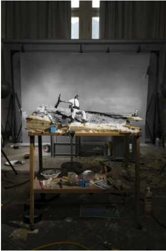
03/1 Aus der Ausstellung Reconsidering Icons . Jojakim Cortis & Adrian Sonderegger, Making of "Loyalistischer Soldat im Moment des Todes, Córdoba Front, Spanien" (von Robert Capa, 1936), aus der Serie Icons , 2016