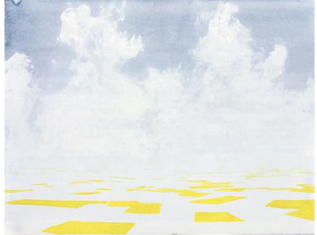
02_o.T. (raps III), 2019 ©Klaus Lomnitzer