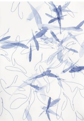
11_o.T. (pond of plenty II), 2017 ©Klaus Lomnitzer