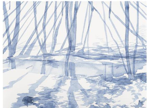
10_o.T. (wald I), 2016