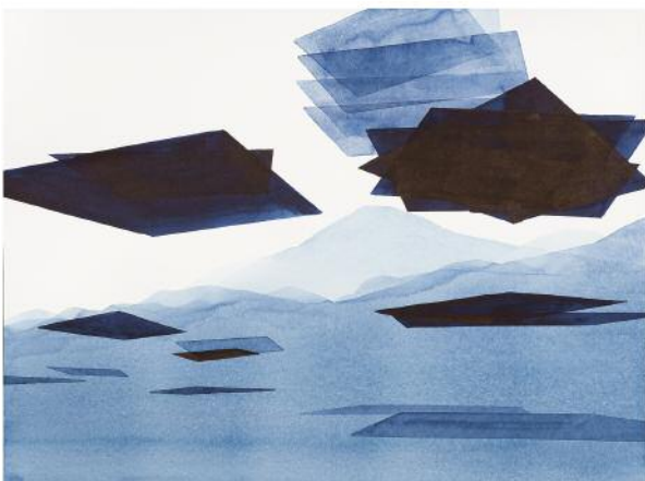
05_o.T., 2016 ©Klaus Lomnitzer