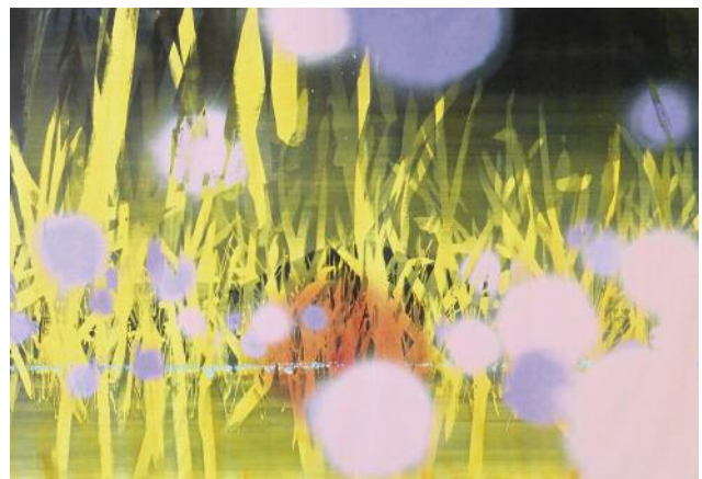
12_o.T., 2015 ©Klaus Lomnitzer