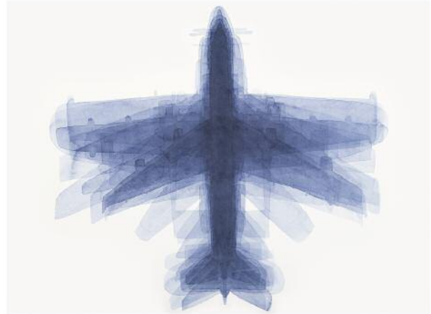
04_o.T. (flugzeuge), 2016 ©Klaus Lomnitzer