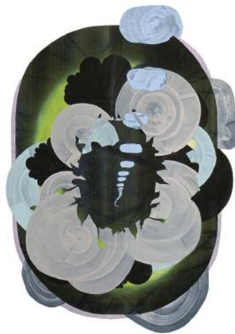
06_o.T. (d.s.d.k.ü.s.d.a.s.), 2015 ©Klaus Lomnitzer