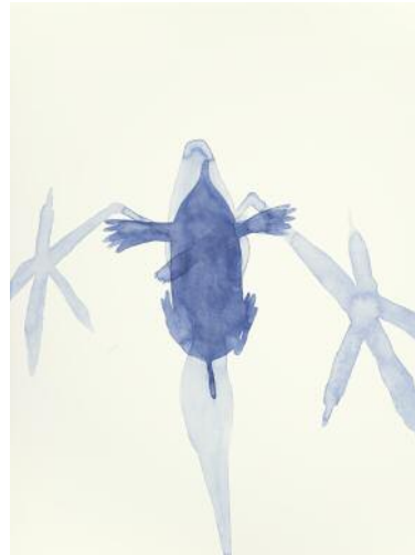
08_o.T. (angebot und nachfrage), 2016 ©Klaus Lomnitzer