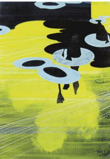
0_o.T. (duckdiving I), 2015