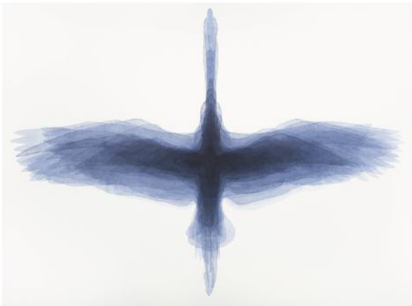
03_o.T. (vögel), 2016 ©Klaus Lomnitzer