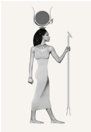
9_Figure: Hathor © Marc Erwin Babej