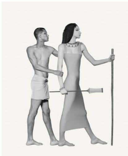
11_Figures: Couple Embracing © Marc Erwin Babej