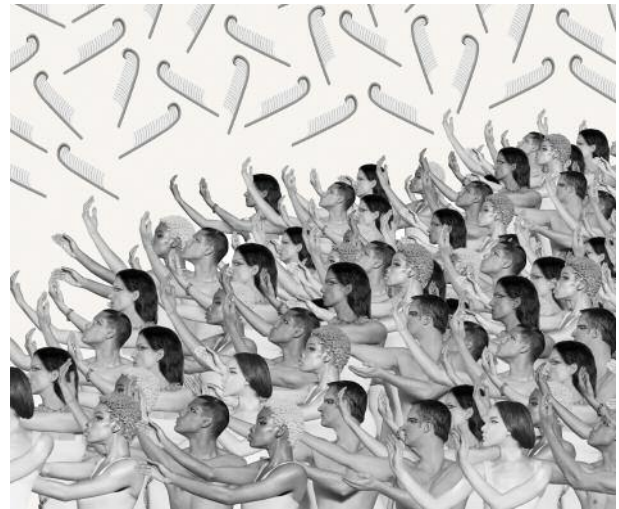
2_Jubilant masses (scene from Soft Power)