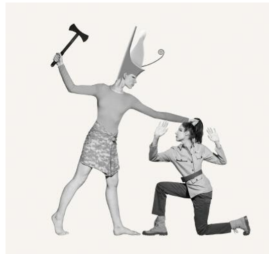
12_Smiting the enemy (scene from the relief Hard Power) © Marc Erwin Babej