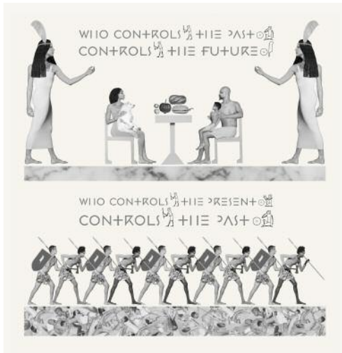
3_Photographic relief: Law and Order