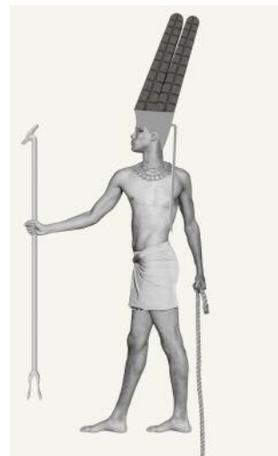
10_Figure: Amun © Marc Erwin Babej