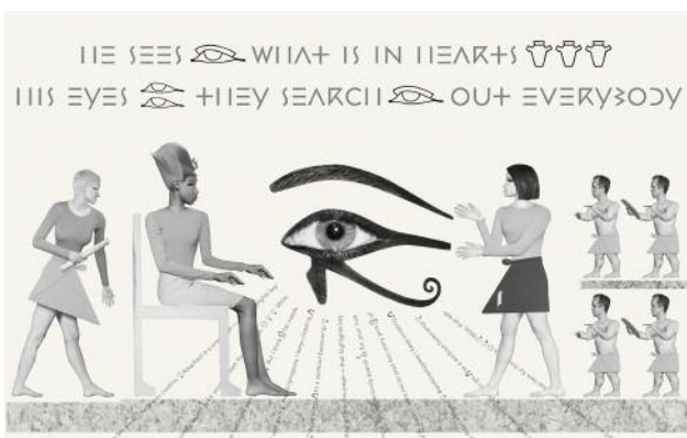
5_The king and his vizier (scene from the relief Horus is Watching You)