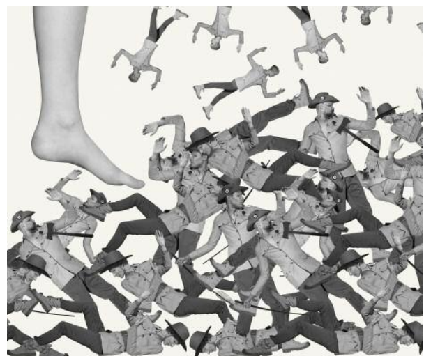
6_Trampling (scene from the relief Hard Power) © Marc Erwin Babej