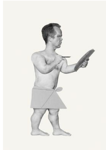
8_Figure: Scribe © Marc Erwin Babej