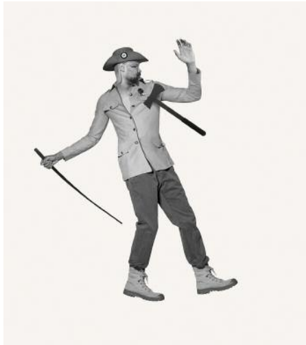
7_Figure: Wounded Enemy