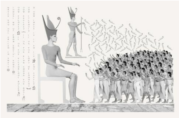
1_Photographic relief: Soft Power