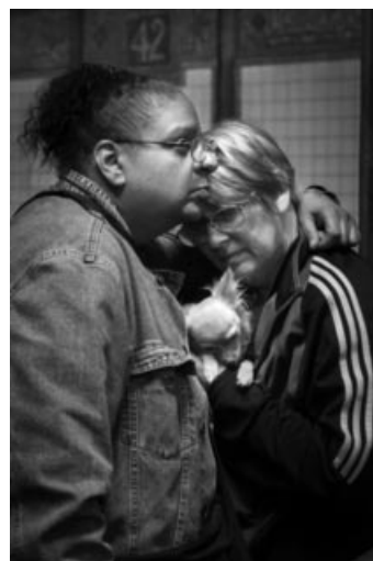
12_ © Mario Schneider