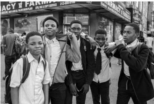
03_ © Mario Schneider