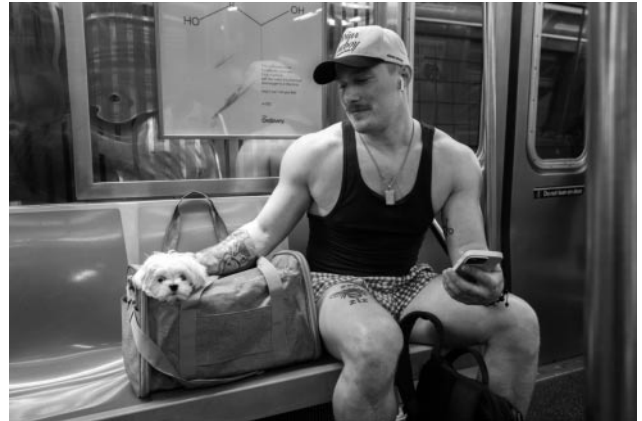
02_ © Mario Schneider