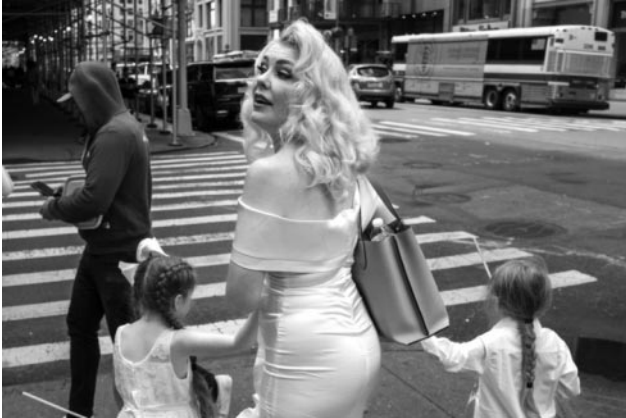
01_ © Mario Schneider