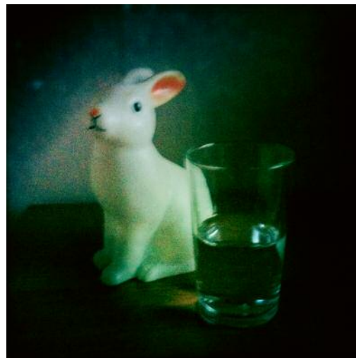
12_ © Mathilde Helene Pettersen