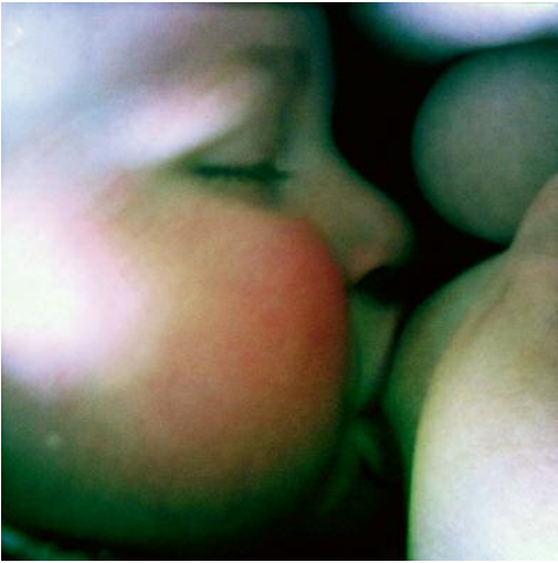
01_ © Mathilde Helene Pettersen