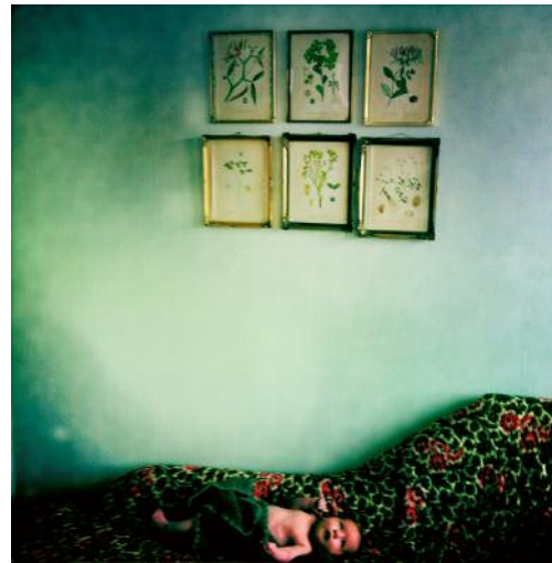
06_ © Mathilde Helene Pettersen