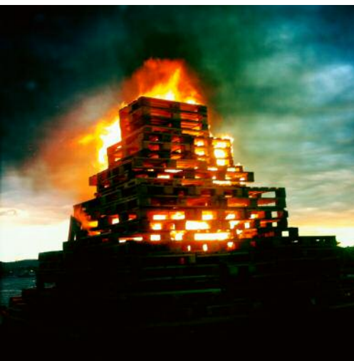
11_ © Mathilde Helene Pettersen