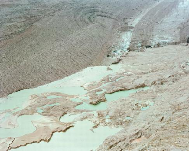
07_Transient Area, 2016 © Michael Goldgruber und VG Bild-Kunst, Bonn