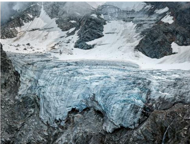
03_Eisbruch, 2021 © Michael Goldgruber und VG Bild-Kunst, Bonn