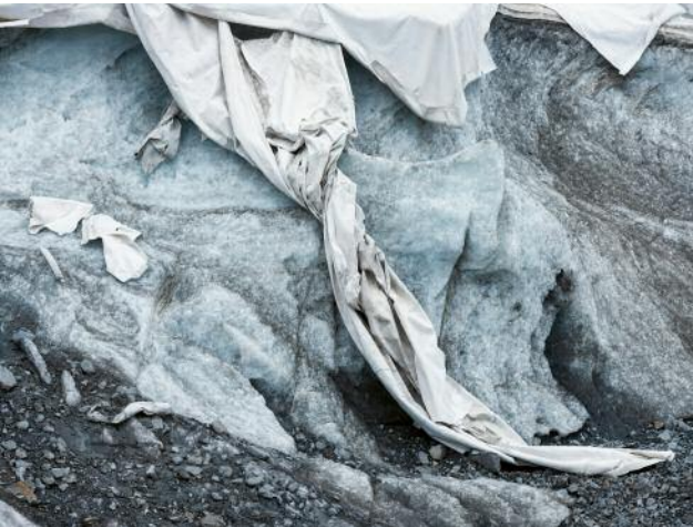
09_Restmodul, 2019 © Michael Goldgruber und VG Bild-Kunst, Bonn