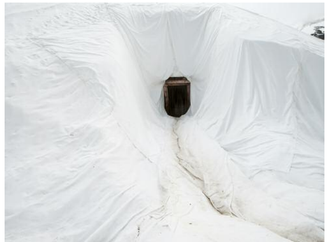
04_Entrance, 2020 © Michael Goldgruber und VG Bild-Kunst, Bonn