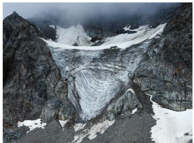
06_Slack Fields, 2020 © Michael Goldgruber und VG Bild-Kunst, Bonn