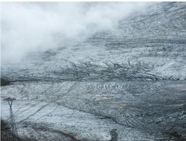
11_Randzone, 2022