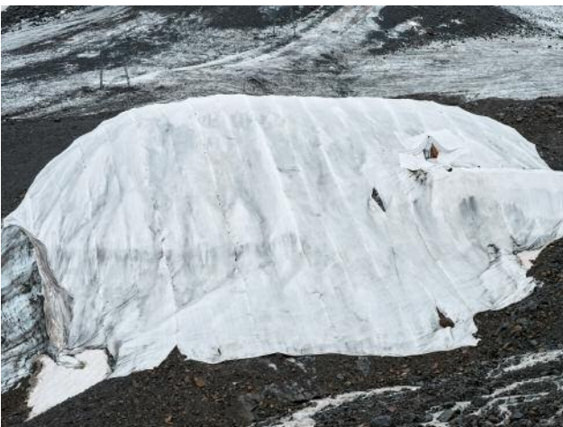
05_Restmodul, 2023 © Michael Goldgruber und VG Bild-Kunst, Bonn