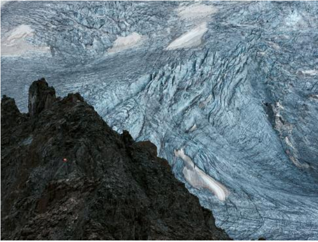
01_Bruchzone, 2022 © Michael Goldgruber und VG Bild-Kunst, Bonn