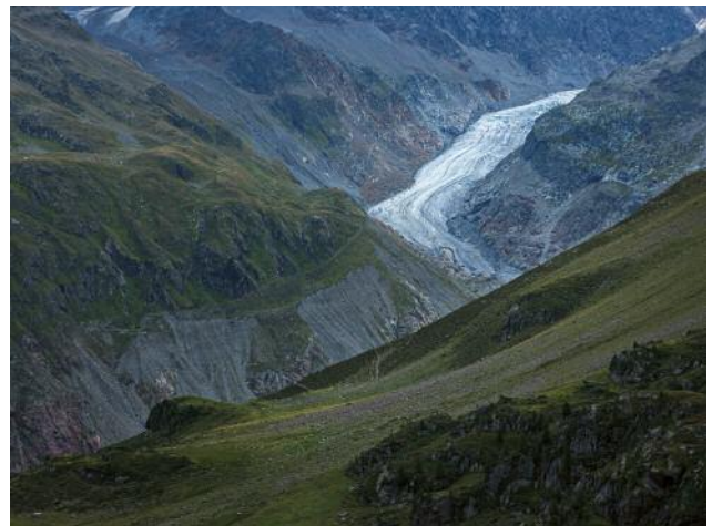
12_De.Frost.Zones, 2022 © Michael Goldgruber und VG Bild-Kunst, Bonn