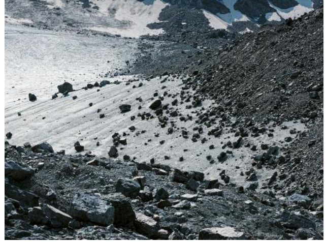
02_Bruchzone, 2021 © Michael Goldgruber und VG Bild-Kunst, Bonn