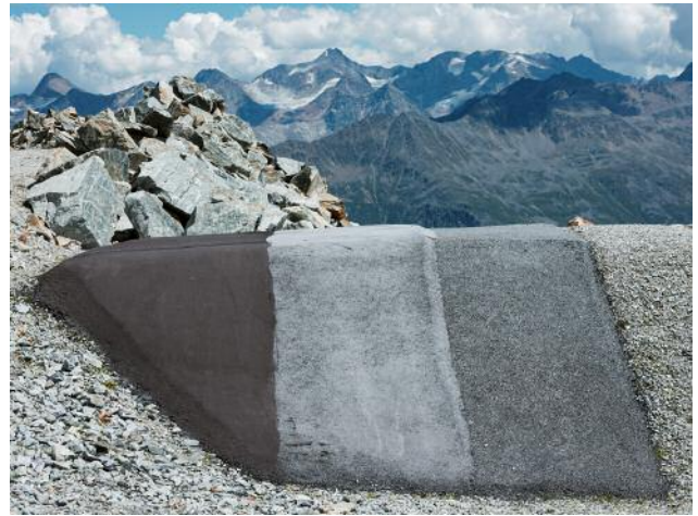
10_Randzone, 2022 © Michael Goldgruber und VG Bild-Kunst, Bonn