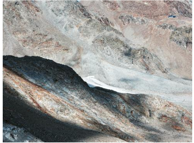
08_Transient Area, 2022 © Michael Goldgruber und VG Bild-Kunst, Bonn