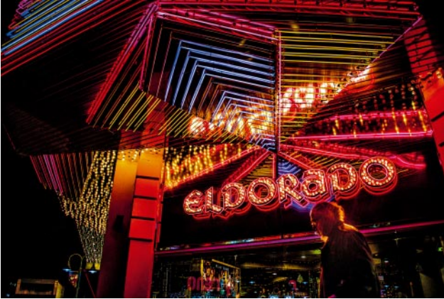
07_ © Michael Rababy