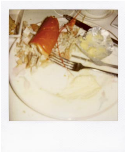
07_pol 9.031 © Michaela Spiegel