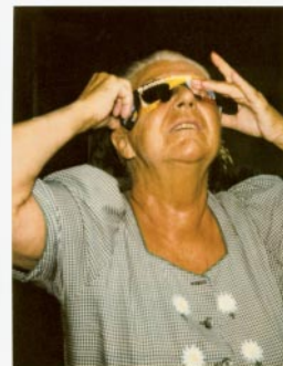
06_pol III5_3/12 © Michaela Spiegel