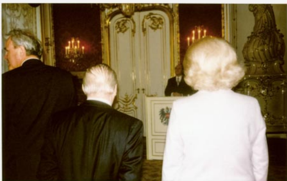
05_polX1_3-2_1.7 © Michaela Spiegel