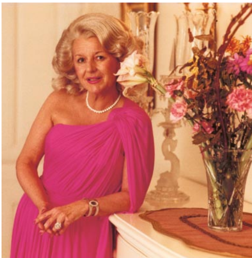
03_Vienna, ca 1979 © Michaela Spiegel