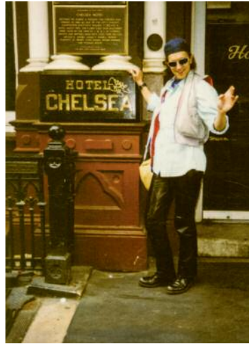
08_New York, 1995 1995.227