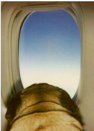
09_Sky High, 2011 pol 11.006/3 © Michaela Spiegel