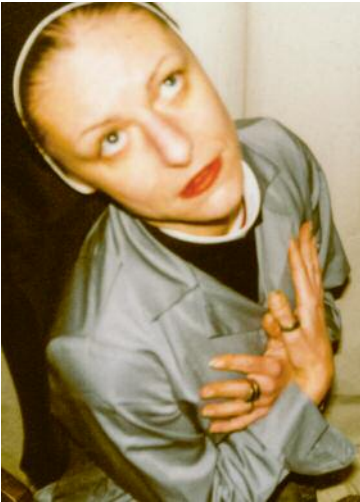
07_Vienna, 2001 V24_2/1