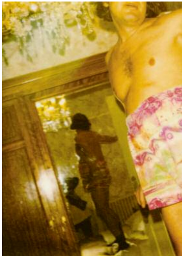
03_Deauville, 1994, 120_2/2