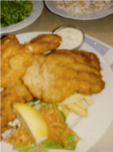
01_Vienna, 2007 pol 3.049