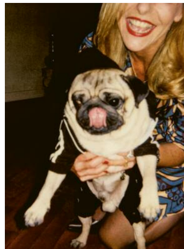
10_Paris, 2006 pol 1.091/1 © Michaela Spiegel