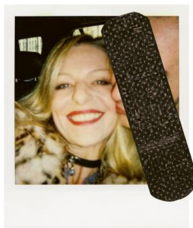
12_Paris, 2007 pol 3.007/4 293