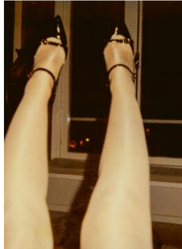
02_Amsterdam, New Years's Eve 2009 pol 6.103/3