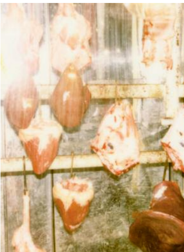
11_Istanbul, 2000 V11_1/1 © Michaela Spiegel