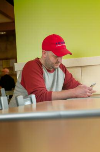
09 Johnson City, TN 2014 © Mike Smith