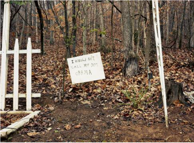
07 Hampton, TN 2010