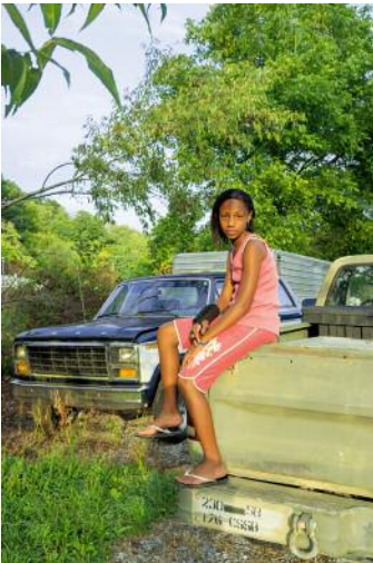
03 Watauga, TN 2014