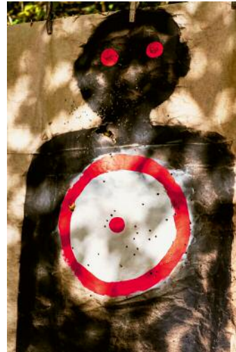
04 East Tennessee 2014