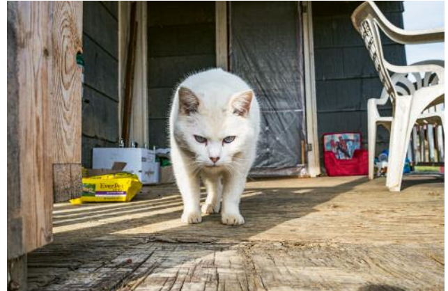
06 East Tennessee 2013