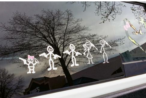
05 Johnson City, TN 2014 © Mike Smith