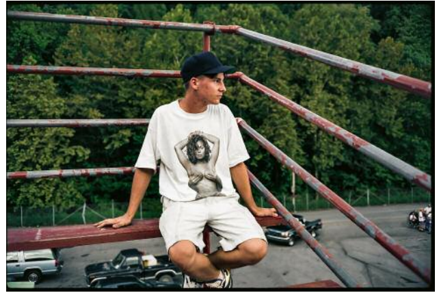
08 Bristol, TN 2014 © Mike Smith