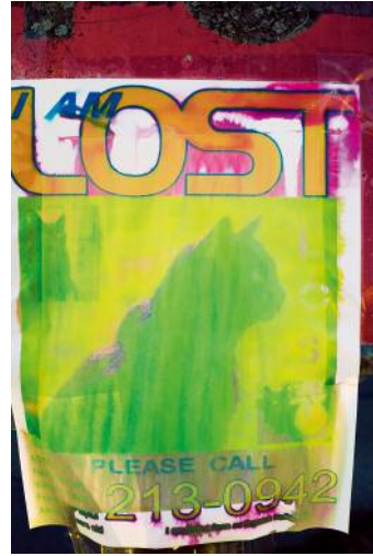
02 Carter County, TN 2013