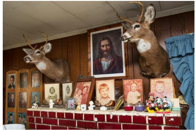
10 Green County, TN 2013