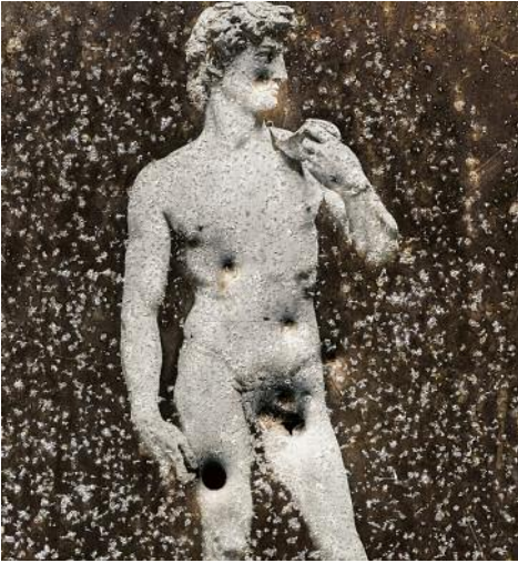
01 Erwin, TN 2018