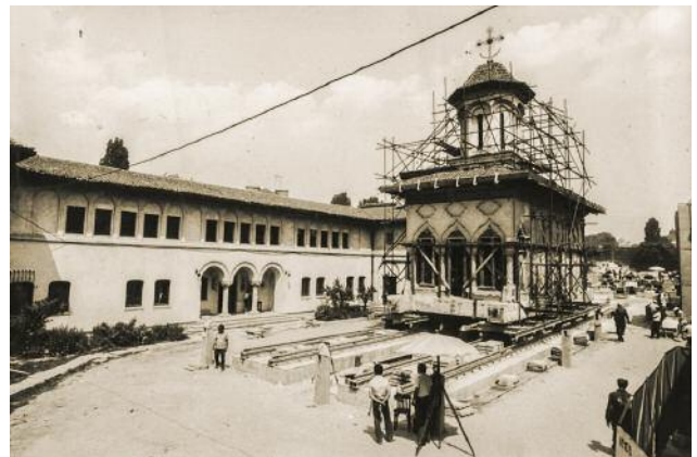
10B_Versetzung der Verkündigungskirche der »Nonnen-Einsiedelei«, Bukarest 1982