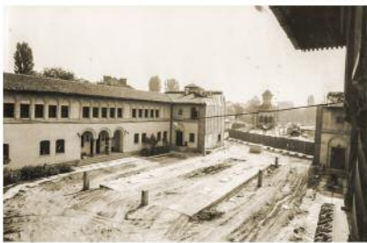
10A_Versetzung der Verkündigungskirche der »Nonnen-Einsiedelei«, Bukarest 1982