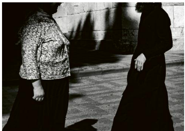
12 © Monika Barth