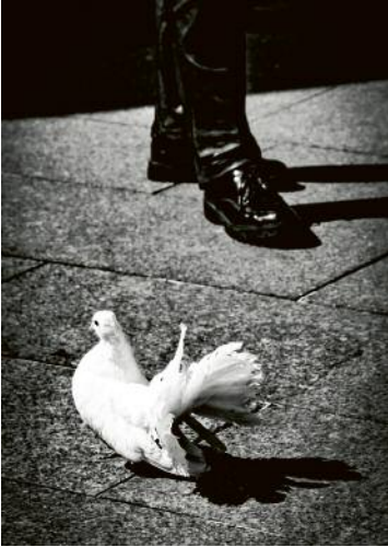
07 © Monika Barth