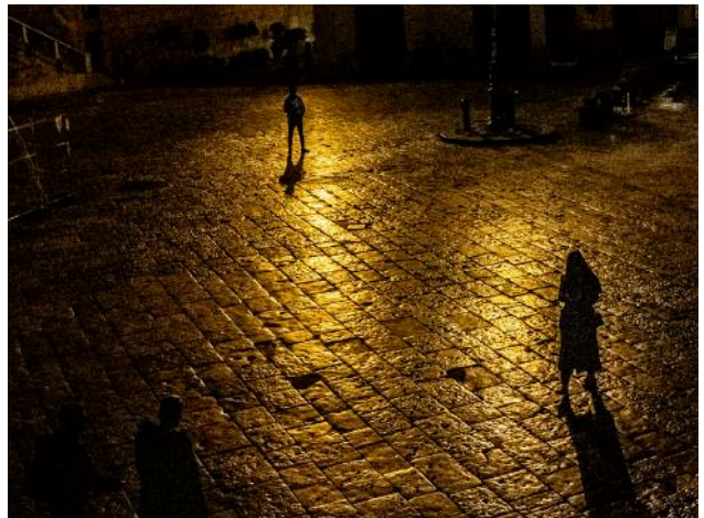
06 © Monika Barth