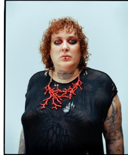
12_ Tal