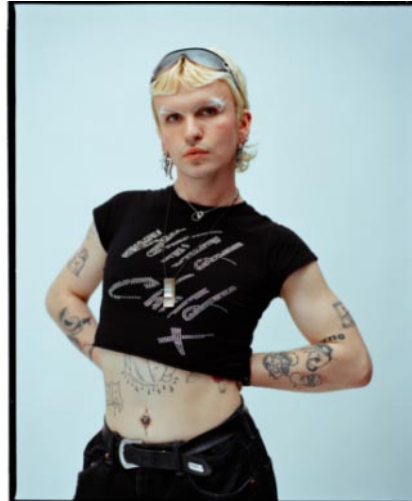
06_ Magor