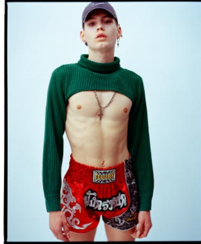
10_ Pasquale