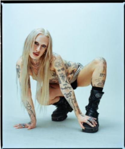
01_ Bae