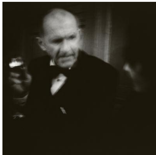
06_ © Øyvind Hjelmen