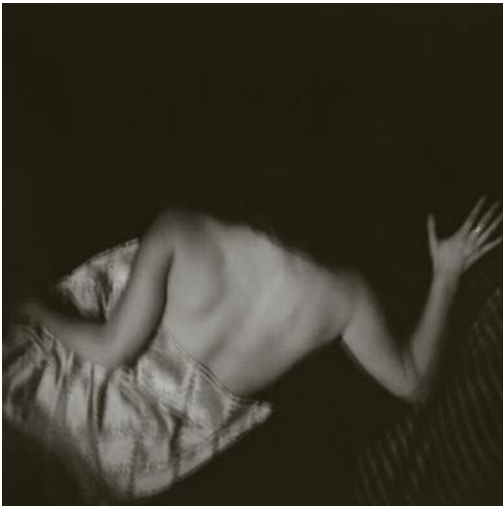
03_ © Øyvind Hjelmen