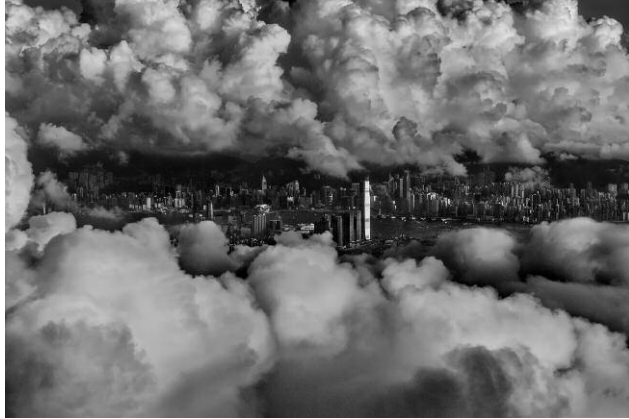
01 © Palani Mohan