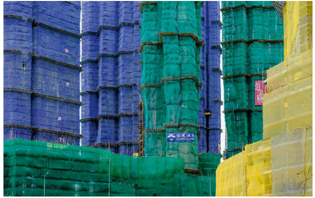
08 © Palani Mohan