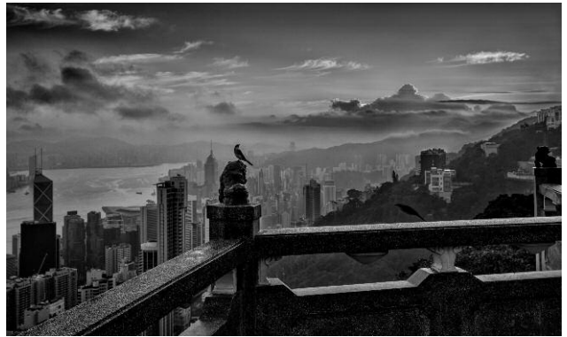
10 © Palani Mohan