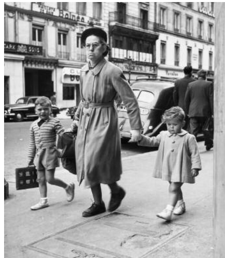
06 Peter Fink, French Governess with Children, Paris, France, 1953 © VG Bild-Kunst, Bonn, 2020