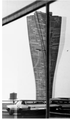
14 Peter Fink, Refractions, Chicago, Illinois, USA, 1970s © VG Bild-Kunst, Bonn, 2020