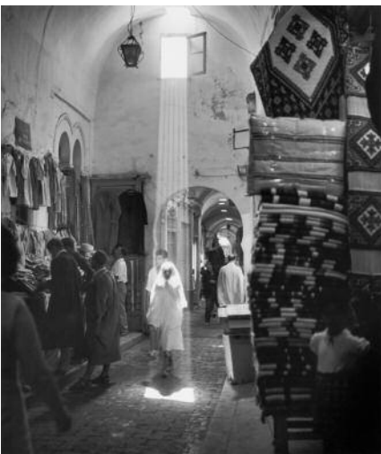
05 Peter Fink, Souk in Tripoli, Libya, 1965 © VG Bild-Kunst, Bonn, 2020