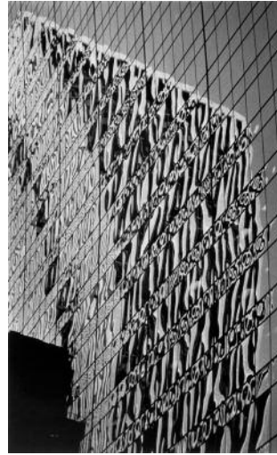
10 Peter Fink, Refractions, New York City, New York, USA, 1975