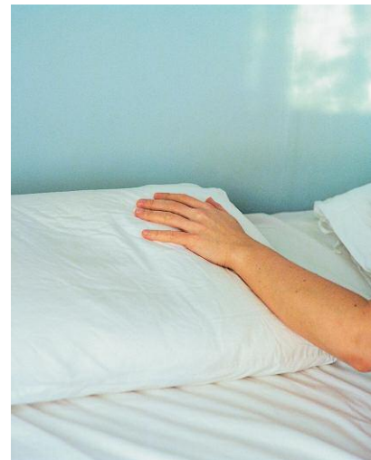
4. © Ida Pimenoff