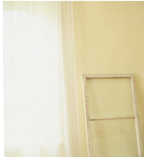
2. © Ida Pimenoff