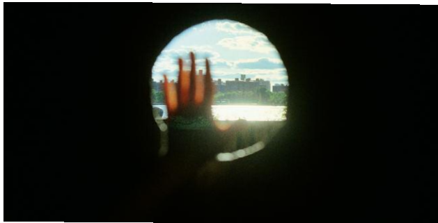
3. © Ida Pimenoff