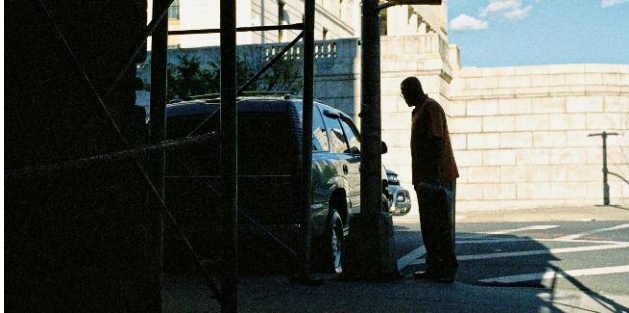
1. © Ida Pimenoff