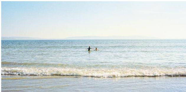
9. © Ida Pimenoff