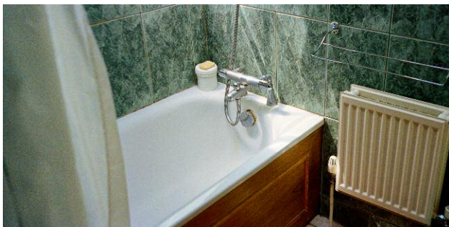
5. © Ida Pimenoff