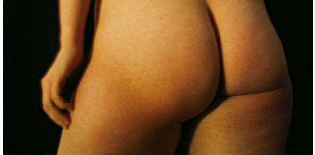
8. © Ida Pimenoff