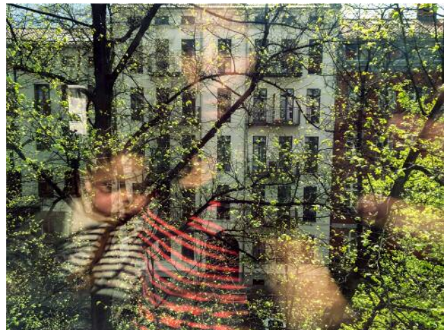
06_ © Rachel Papo