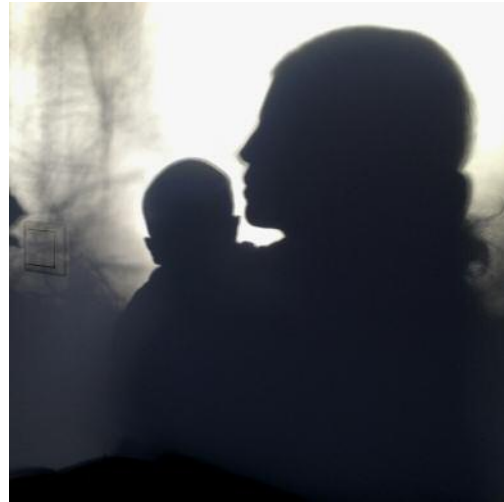
08_ © Rachel Papo