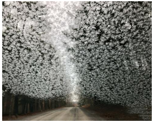
10_ © Rachel Papo