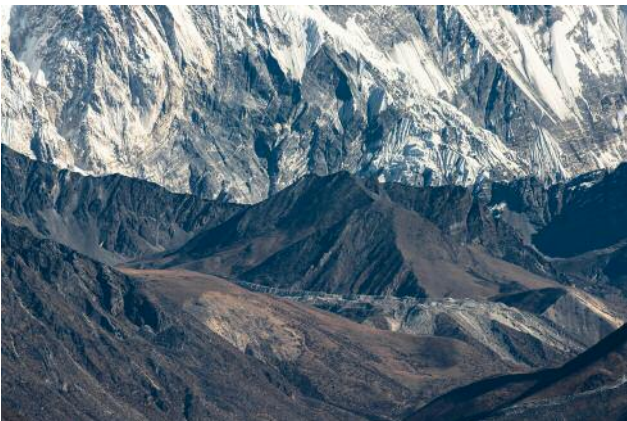
11_PLATE 85 Nepal, Himalayas, Everest Region, 2016