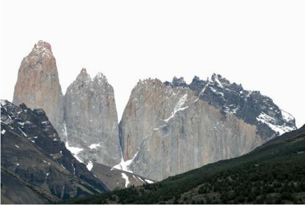
07_PLATE 132 Torres Del Paine, Patagonia, Chile, 2019