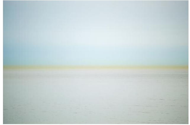
02_PLATE 70 Atlantic Ocean, USA, 2010