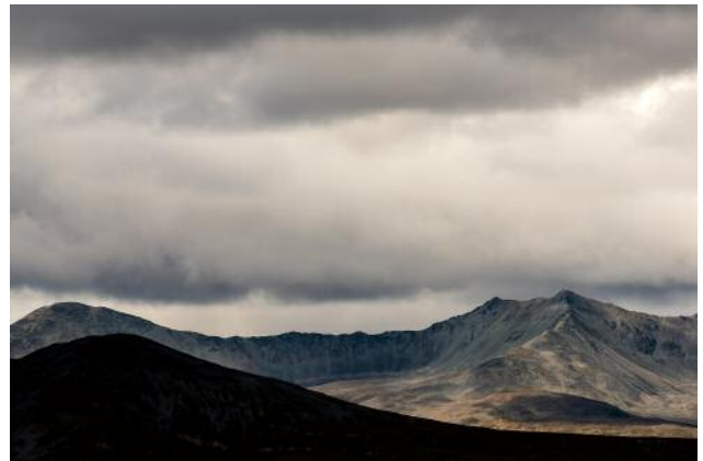
06_PLATE 97 Alaska, Valdez Range, 2017