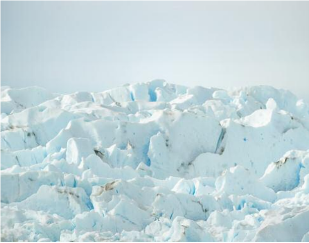
01_PLATE 118 Grey Glacier, Patagonia, Chile, 2019