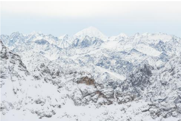
09_PLATE 106 German Alps, 2019