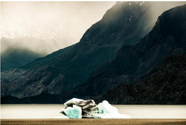
05_PLATE 123 Grey Glacier, Patagonia, Chile, 2019 © Renate Aller