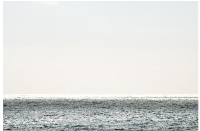
10_PLATE 75 Atlantic Ocean, USA, 2020