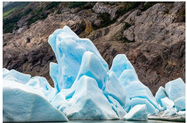
12_PLATE 128 Grey Glacier, Patagonia, Chile, 2019