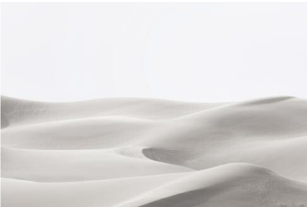
03_PLATE 81 Great Sand Dunes, Colorado, USA, 2013