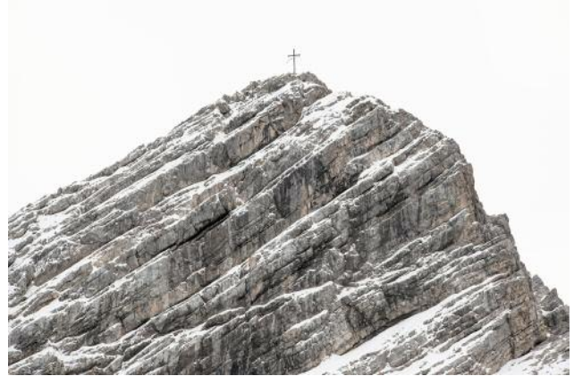
08_PLATE 109 Great Sand Dunes, Colorado, USA, 2013