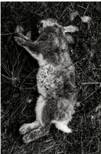
05 © Richard Gosnold