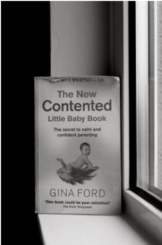
01 © Richard Gosnold