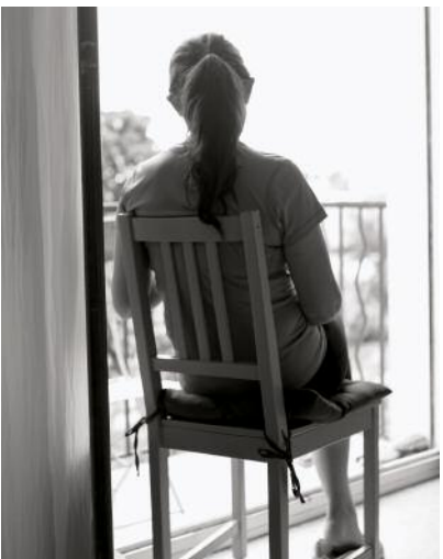
11 © Richard Gosnold