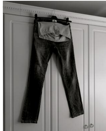
04 © Richard Gosnold