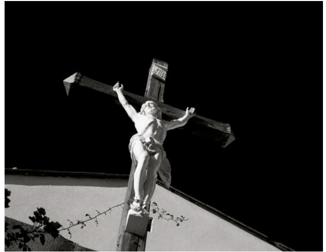
02 © Richard Gosnold