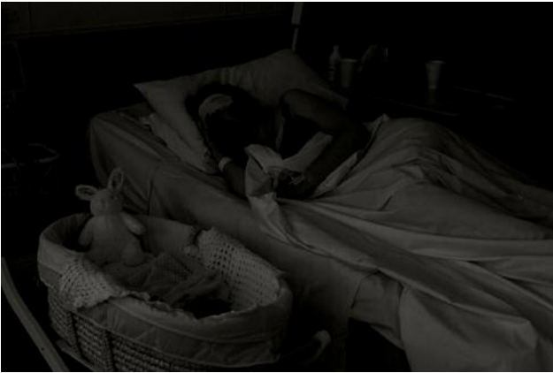
07 © Richard Gosnold