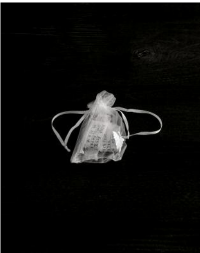
09 © Richard Gosnold