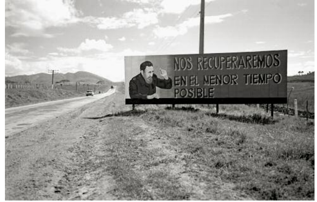
08_ MAYABEQUE — MATANZAS “We Will Overcome in the Speediest Possible Time”; so reads a bill-board in the middle of nowhere en route to Mayabeque.