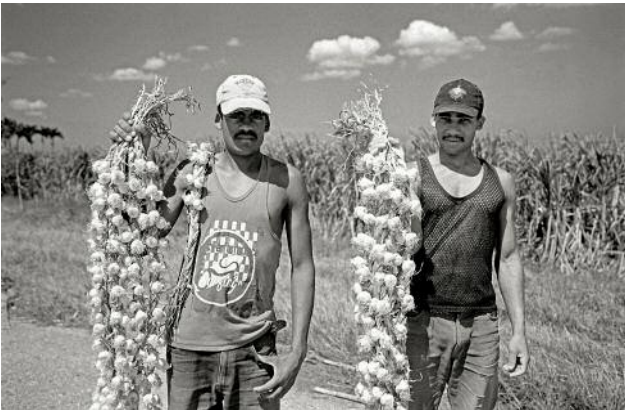
09_ CIENFUEGOS_ On a meandering dusty road in Cienfuegos, peddlers wave me down to sell me garlic. Garlic is the second-most cultivated spice in Cuba.