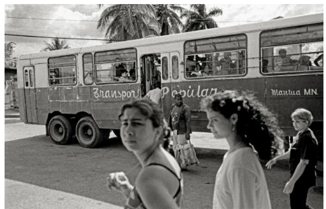
06_ARTEMISA — LA HABANA_Bus service is at best unreliable in Cuba, with Viazul being the leading bus service covering the island's entirety