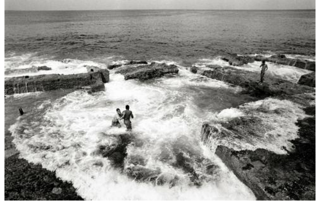
02_LA HABANA_Havana's Malecon stretches across the whole length of Avenida de Maceo's esplanade.