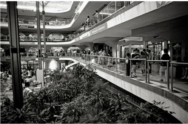
03_LA HABANA_An indoor mall in Old Havana.