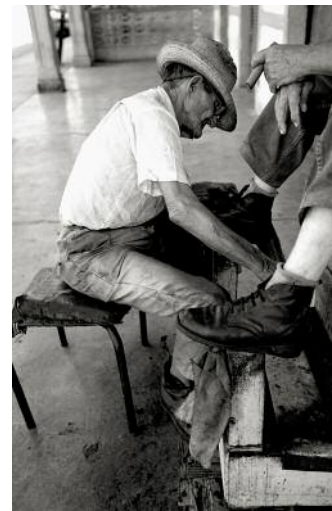
10_ SANCTI SPÍRITUS_ In 2002, shoe shining was ubiquitous in Cuba. Today's shoes don't need shining as much as old shoes.