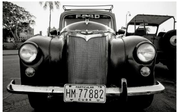
12_ CAMAGÜEY — LA HABANA_ An obligatory picture of an old American car. Kia, Hyundai, and Peugeot are the leading car importers to the Island.