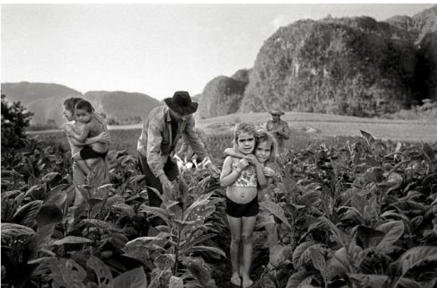
05_PINAR DEL RÍO_Cuba's Vuelta Abajo region — Pinar del Rio — produces the world's most delicate tobacco leaves.