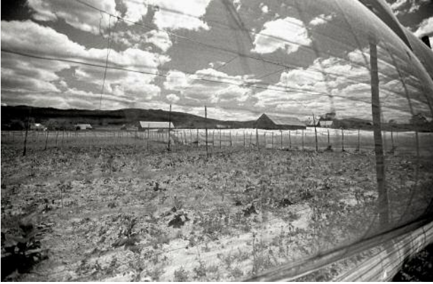
07_ ARTEMISA — LA HABANA_ Only one-third of Cuban land is arable and fertile, yielding upwards of two crops per year.