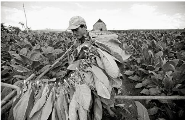
11_ CIEGO DE ÁVILA_ Ciego de Ávila Province devotes 730 hectares to tobacco harvesting. Five hundred of these hectares are dedicated to “tapado” (a shade-grown wrapper leaf technique).