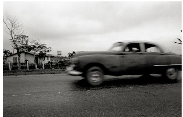
04_PINAR DEL RÍO_Speeding car in Via Blanca heading east to Guanabo — a highway in the north that connects Havana to Matanzas