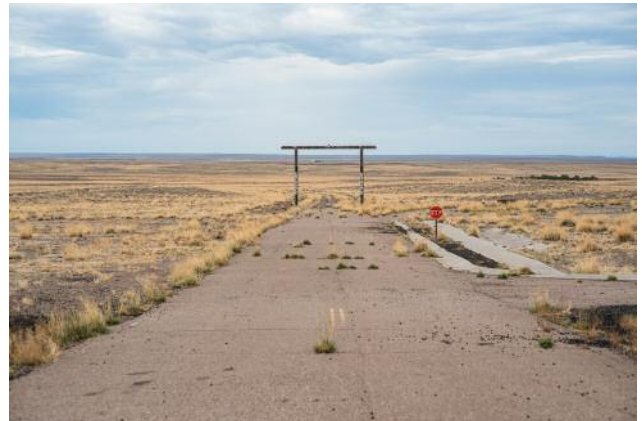
10_Sun Valley, Arizona