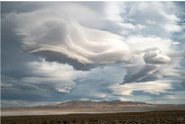
03_Inyo County, California