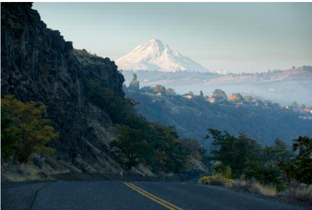
05_The Dalles, Oregon