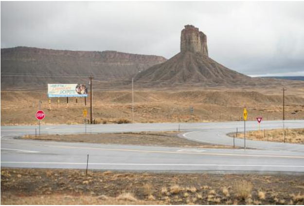
01_Towaoc, Colorado