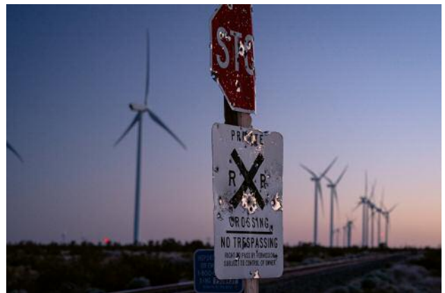
12_Mojave, California © Rob Hammer