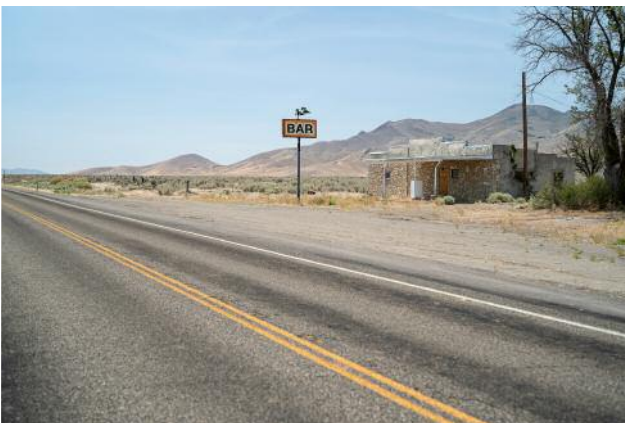
11_Rebel Creek, Nevada