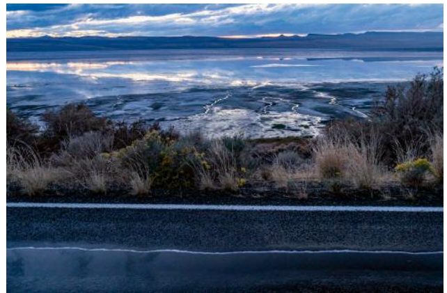
6_Valley Falls, Oregon