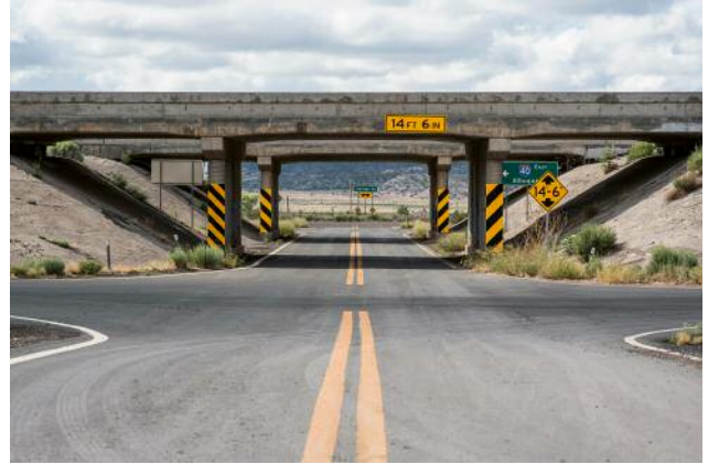
08_Houck, Arizona