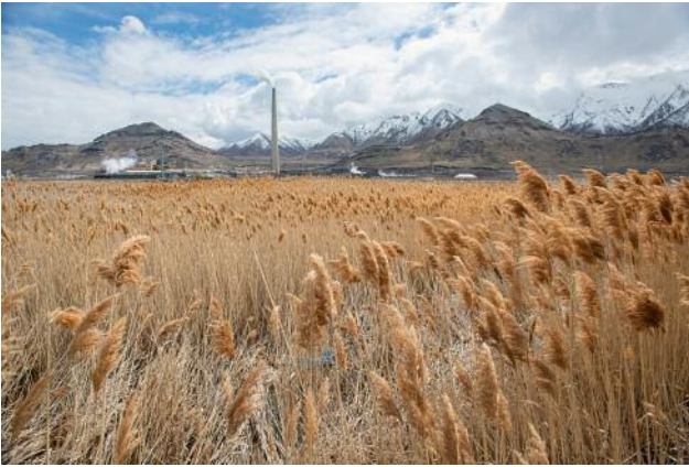
07_Arthur, Utah