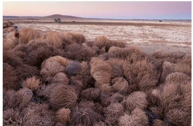
04_Coalinga, California