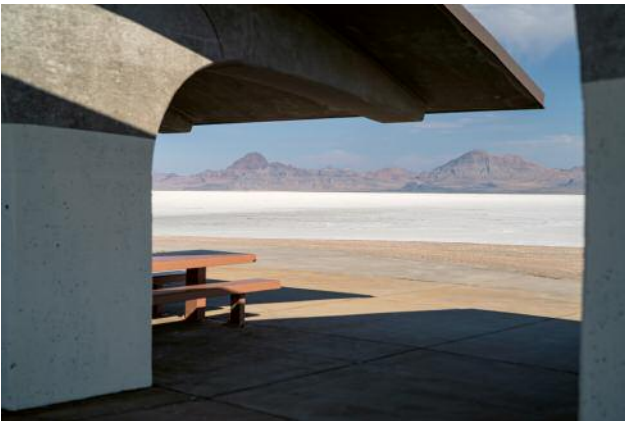
09_Bonneville, Utah