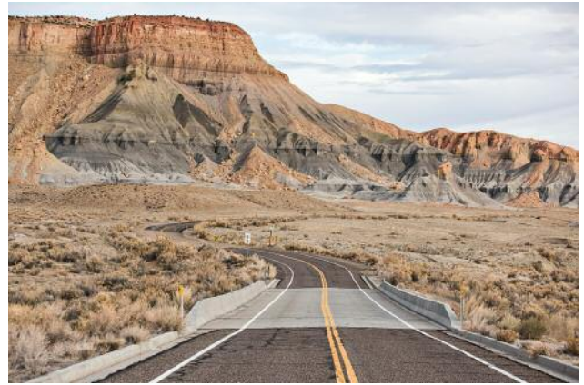
02_Emery, Utah